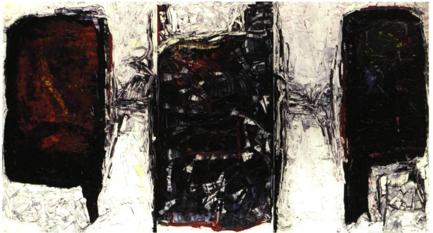
Les masques, 1964 Triptyque : 195,5 x 357 cm Huile sur toile

A U COURS DU MOIS RIOPELLE , SERONT LANCÉS L'ÉDITION DU CONTE POUR ENFANTS, SONGO ET LA LIBERTÉ DE GILLES VIGNEAULT QUI S'EST INSPIRÉ D'UNE PEINTURE DE RIOPELLE, UNE MONOGRAPHIE SIGNÉE RENÉ VIAU ET RIOPELLE AU MUSÉE DU QUÉBEC : HISTOIRE BRÈVE ET MORCEAUX CHOISIS . DE PLUS, QUELQUES-UNES DES VOITURES DE LA COLLECTION DE RIOPELLE SERONT EXPOSÉES DANS L'AUDITORIUM DU MUSÉE.