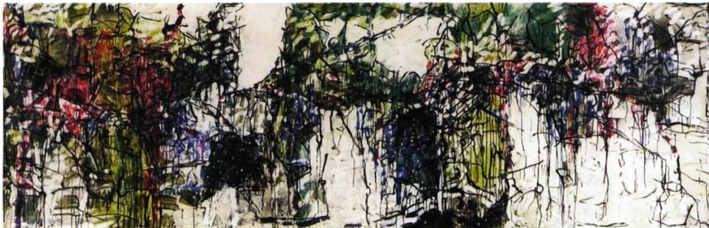
Blanc, noir, vert et rouge strié de noir (1964). Dessin: 195,5 x 410 cm Technique mixte

« Le Musée du Québec possède la plus importante collection publique d'œuvres de Riopelle au monde », rappelle John Porter, son directeur. Les quelque trois cents pièces de l'artiste constituent également la collection la plus représentative de toutes ses périodes de production. D'ailleurs, une salle du musée est exclusivement consacrée aux œuvres de Riopelle. De cette façon, le Musée du Québec rend donc un hommage permanent à Riopelle.