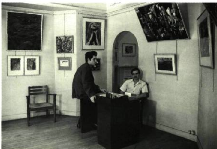
Jean-Paul Riopelle et Fernand Leduc Galerie du Luxembourg Paris, 1947