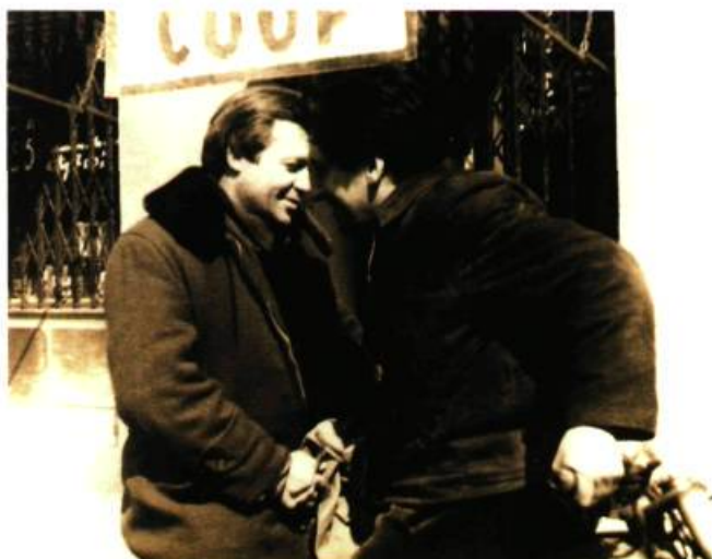
Jean-Paul Riopelle en compagnie de Sam Francis Paris, 1956