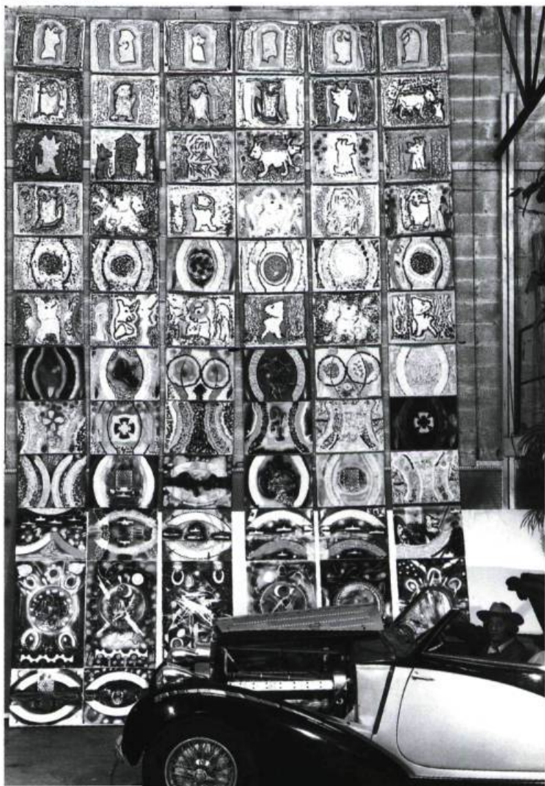
Jean-Paul Riopelle Atelier de Saint-Cyr-en-Arthies, 1989