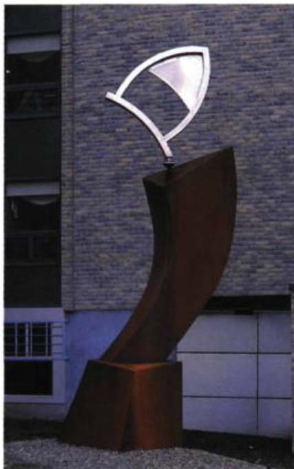
L'envoileure d'éole , 2000 Sculpture éolienne Programme d'intégration des arts à l'architecture CHSLD Vaudreuil 700 x 250 x 175 cm