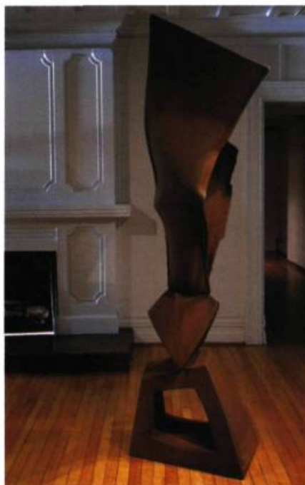
La déchirure , 2000 Acier Corten 190 x 75 x 50 cm