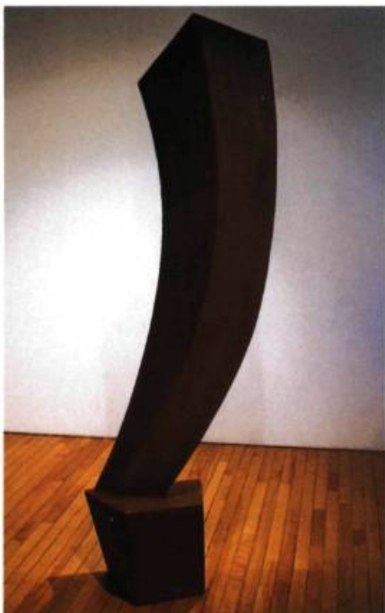
La voileure , 2000 Acier Corten 190 x 60 x 45 cm Photo : Michel Dubreuil