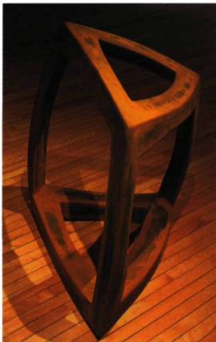
La lanterne , 2000 Acier Corten 110 x 100 x 90 cm Photo : Michel Dubreuil