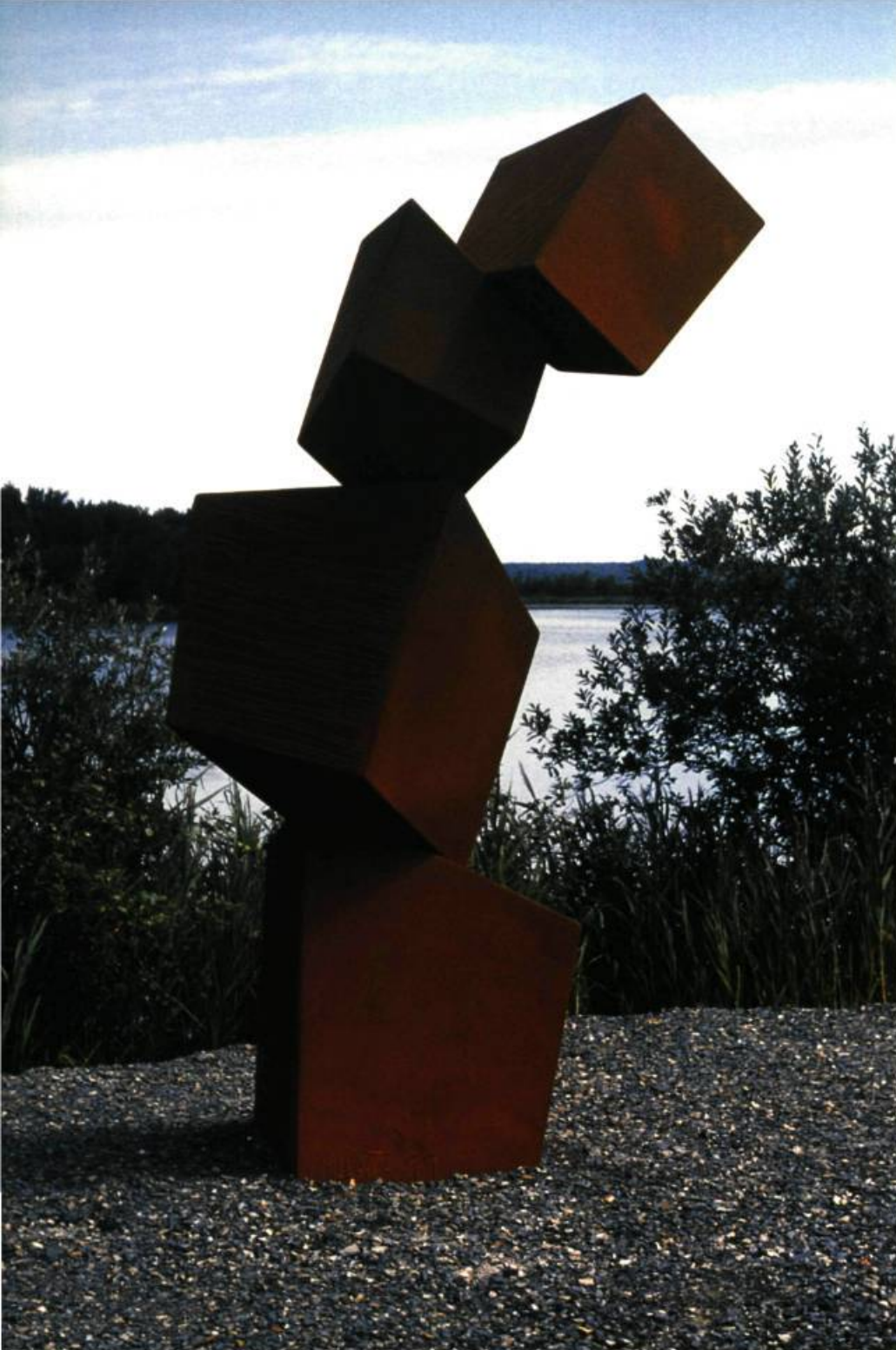
Fébrilité , 1999 Acier Corten 325 x 150 x 150 cm 3 e Symposium International de l'Estriade de Granby Coll. Ville de Granby

Heureusement, certains artistes, et Claude Millette est de ceux-là, échappent à cette succession des classissimes. Leurs productions n'ignorent pas l'histoire; elles s'y réfèrent sans toutefois la reproduire. Elles n'en détruisent pas complètement les codes: elles les dérangent, les pervertissent seulement, et parfois très légèrement. Sans