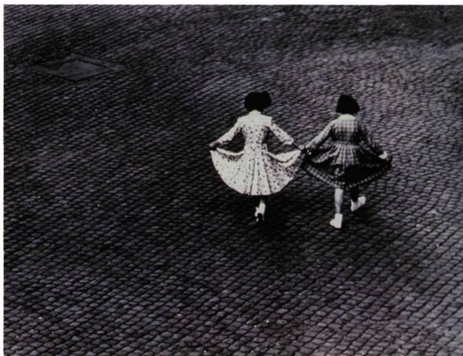
Vue par la fenêtre II: la danse des robes

Au cours de cette période, l'artiste joue plus que jamais avec la technique, usant des superpositions (de négatifs, de masques) et des jeux de réflexion (sur des fenêtres et des miroirs), mais jamais au détriment d'un langage pictural naissant. Les portraits