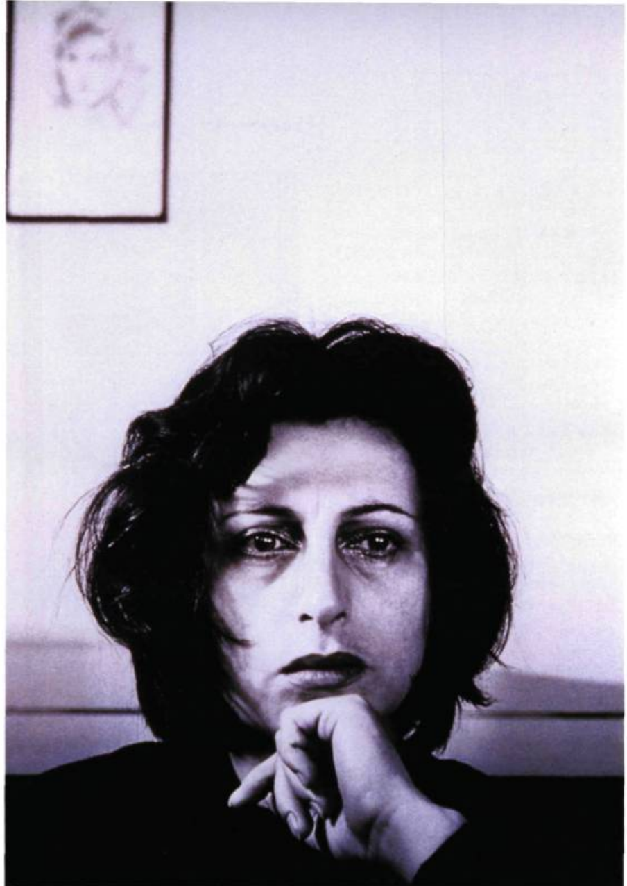
Anna Magnani I San Felice Circeo, 1950 Épreuve argentique à la gélatine

Jeune homme sur un rocher probablement Ligurie, 1936 Épreuve argentique à la gélatine 9 x 21,5 cm