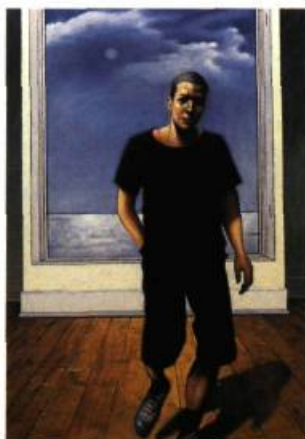
Kai McCall Adrian, 2001 Huile sur toile 182,9 cm X 132,1 cm

Kai McCall peint des personnages qui dégagent une telle anxiété que la contemplation de ses tableaux suscite inévitablement un malaise. Regards fuyants ou vides, intérieurs exigus et claustrophobiques, parfois ouverts sur de vastes paysages hors de portée. Dépourvus d'indices temporels, tous ses portraits comportent pourtant un élément narratif tel qu'un mouvement en voie de s'accomplir, la trace d'une main sur un objet dans l'arrière plan ou des lettres tracées sur un mur, qui nourrit la lecture.