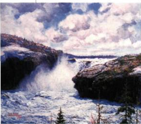
Hal Rosslerriard La Barsimes, 1954

Musée des beaux-arts de Sherbrooke 241, rue Dufferin Sherbrooke Jusqu'au 2 juin 2002 Pour renseignements: (819) 821-2115