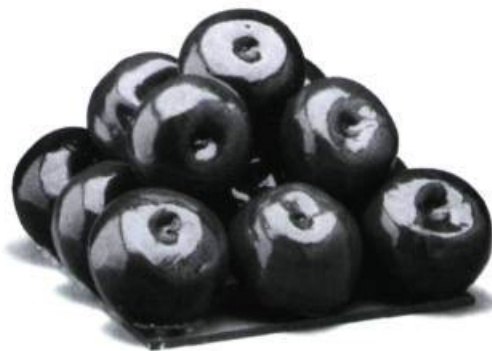
14 pommes-pourmes, 1970, © Gathie Falk, Vancouver Art Gallery