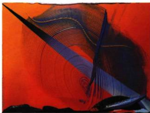
Joseph Drapell Information Highway , 1999 Acrylique sur toile 92 x 125 cm

chimistes industriels qui, selon les demandes, en modifient la viscosité et la luminosité. « Voici donc, écrit Kenworth Moffett, un mouvement issu d'un authentique mariage de l'art et de la technologie. »