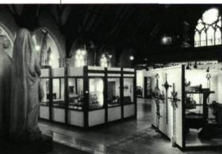
Vue de l'exposition permanente Photo: Marilyn Aitkens, 1995

Le Musée va bientôt fermer provisoirement ses portes de septembre à décembre 2002. Cette période sera consacrée à des travaux de restauration importants ainsi qu'à un renouvellement de l'exposition permanente et à l'élaboration de nouveau matériel pédagogique. Mais, en attendant, les expositions