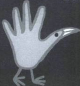
Affiche Les Femmeuses 2002