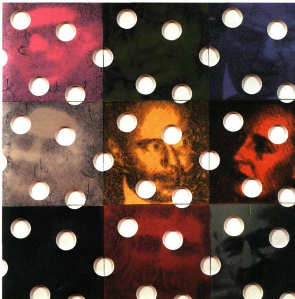
Fossiles , 2000 [cat. n° 7] 12 éléments

T OUT EST MATIÈRE À FUSION CHEZ THOMAS CORRIVEAU : ENTRE FIGURE HUMAINE ET ENTITÉ COSMIQUE S'OPÈRENT DES COULÉES.