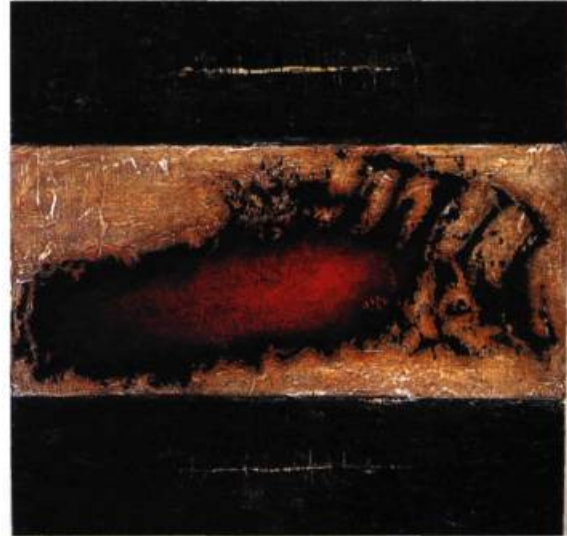
Redbone, 2001 Acrylique sur bois 122 x 122 cm

Trahissant l'attitude du romantisme engagé, Bill Vincent recherche dans les styles et les dogmes du passé, les survivances et les renaissances esthétiques et allégoriques.