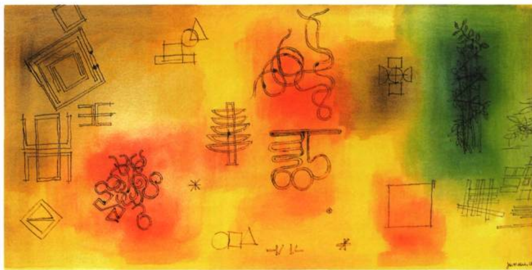
Soleil, 2001 Encre et acrylique sur toile 61 X 22,5 cm

Pour que la communication directe entre l'œuvre et le spectateur se produise, il fallait éviter toute forme d'interférence. Avec mes