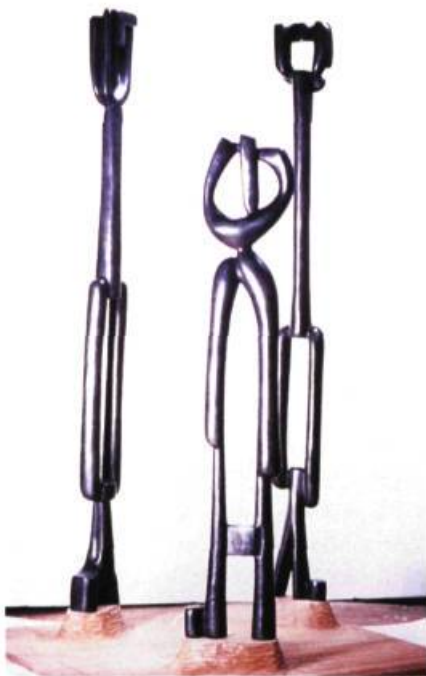
Famille 1, 1988 Bronze et acajou 70 x 40 x 40 cm

œuvre de 1996, Sans titre , un groupe de quatre éléments verticaux. L'artiste se sert d'une géométrie adoucie par des rondeurs et des concavités qu'il définit par des teintes allant du profond vert de Hooker à l'éclatante terre de Sienne. La sculpture entame un dialogue avec l'observateur. Abstraite au premier regard, la pièce a tendance à insister et à suggérer qu'il s'agit en fait d'un groupe de personnes. L'œuvre s'entoure d'un mystère qu'il n'est peut-être pas besoin de résoudre tant sa présence plastique est convaincante.