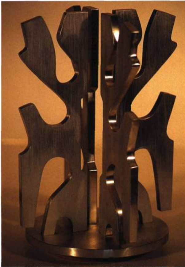
Sans titre 19, 1982 Aluminium 32 x 24 x 24 cm