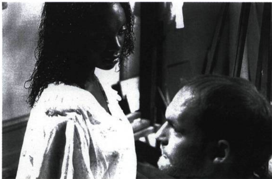
Scène tirée du film Angélique court métrage du réalisateur Michael Jarvis

En outre, au cours d'un symposium organisé par le BTW (Black Theatre Workshop) et les Grands Ballets Canadiens de Montréal, danseurs et chorégraphes afro-américains viendront échanger sur l'influence que l'esclavage a pu avoir sur les arts d'interprétation. Une rencontre captivante qui permettra de donner un éclairage différent au travail des créateurs contemporains.