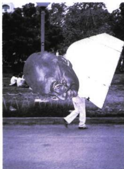
Postcards for Gandhi Ram Rahma, 1995