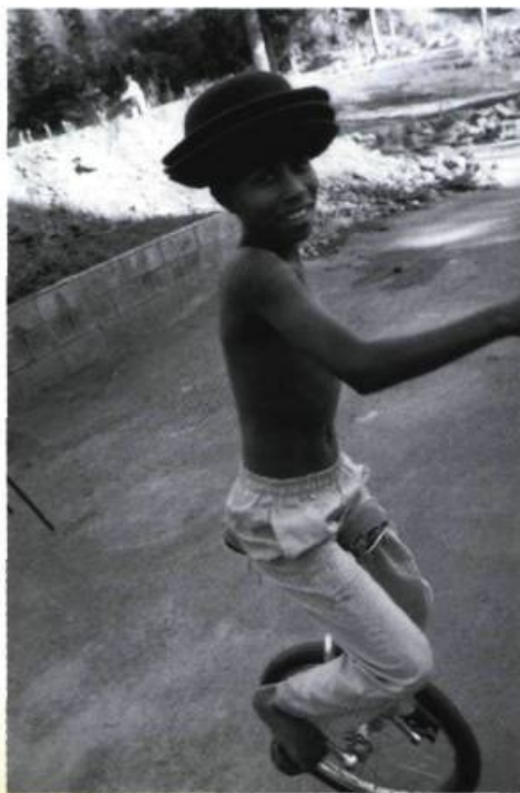
Portrait d'un jeune brésilien qui s'exerce aux arts du cirque. Projet Le cirque du monde

Le public pourra également participer à des ateliers de danse africaine et de samba tandis que la maison de la culture Plateau Mont-Royal accueillera pour l'occasion une exposition de photographies