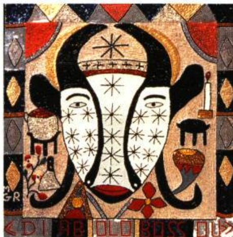
Diabolo Bassou, techniques mixtes, 97 x 100 cm Petit Frère Mogirus, 1998

Placés au cœur du rituel vaudou, les drapeaux servent, notamment, à exercer leur influence magique en favorisant la rencontre entre le monde physique des cinq sens et le Joa (l'esprit). Ces drapeaux, ornés de paillettes et de perles de verre, révèlent une multitude de symboles reliés au Joa . Ce dernier peut épouser une forme humaine ou animale. Les esprits les plus importants exercent leurs influences sur la santé, les cultures agricoles, la vie amoureuse, la sécurité et le destin. Ainsi, dans l'un des pays les plus pauvres de la planète, la foi peut vaincre l'adversité.