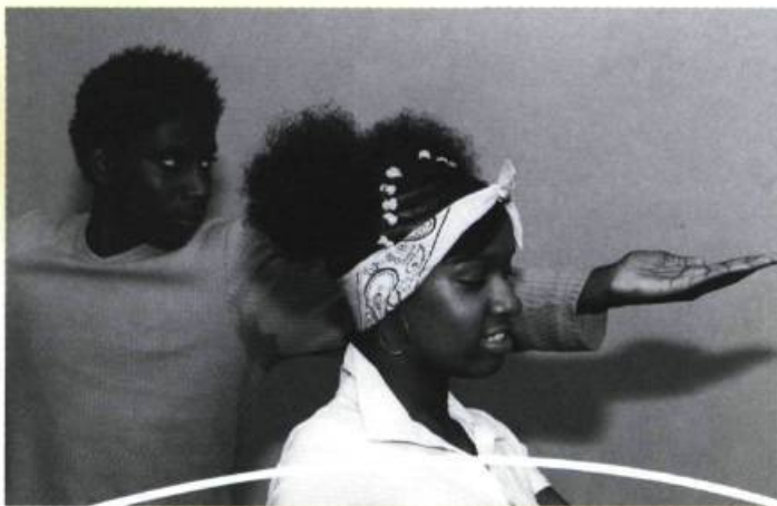
Jeunes performeurs du BTW