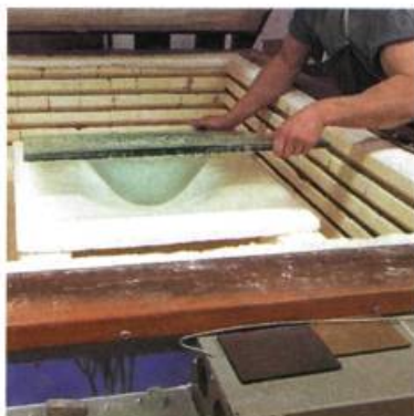
Hectarus™, produits verriers Lavabo Elenali