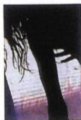
Éditions Éric Devlin (Canada)