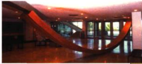
Dimensions : 8ft. high, 36 ft. long, 2ft. wide www.displacedarc.com

Comme les différentes activités s'adressent surtout au grand public, généralement peu familier avec l'art actuel, un savant dosage s'impose pour l'attirer vers Valcourt, où se trouve le Centre, et inciter touristes et gens de la région à faire le détour vers ce creuset des activités de Bombardier, à une demi-heure environ des sentiers battus (en l'occurrence ceux de Sherbrooke et de l'autoroute des Cantons de l'Est).