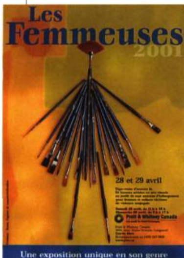
Une exposition unique en son genre