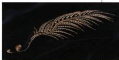
La plume de Cirano , Broche 348 diamants taillés poires et brillants ronds: 37,53 carats; or jaune 18 carats, platine et fil d'acier inoxydable Création: Annick Lucier

Du 10 avril 2001 au 6 janvier 2002 Diamants Musée de la civilisation 16, rue de la Barricade Québec (418) 643-2158 Site web: www.mcq.org