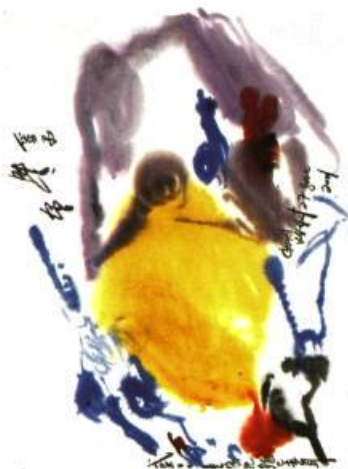
Chan Ky-Yut Aquarelle sur papier, 2001

et des écrivains d'Europe et d'Amérique à la galerie de l'Ambassade du Canada à Washington. Jusqu'au 31 mai 2001.