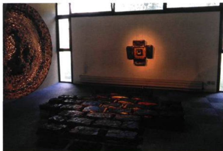
Lieux de rassemblement privé et public , 1993-95. Tissu de récupération et polyuréthane. Tressage et plastification.

C'est à mon sens là où réside l'originalité de la démarche de Carole Simard-Laflamme. Née d'un savoir-faire propre aux arts textiles, la virtuosité technique déployée dans le cycle De Natura permet d'enrichir la pratique contemporaine de la sculpture et de l'installation d'une réflexion matiériste très pertinente. □