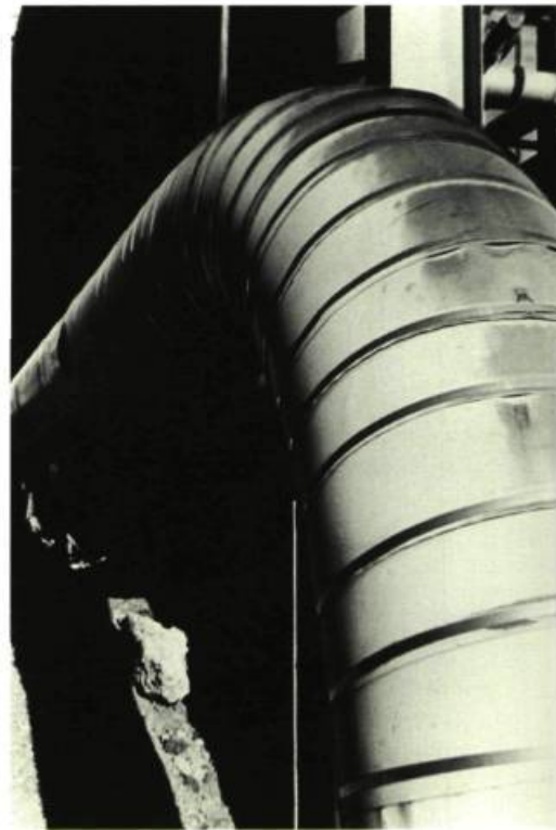
Minor White, Sans titre , tirage de 1978 14 3/4 x 11 3/4 pouces Musée des beaux-arts de Sherbrooke