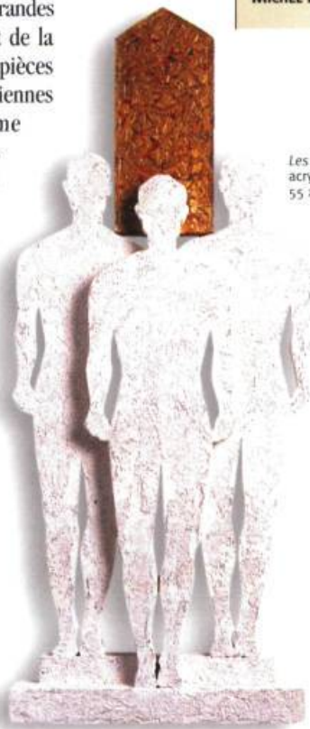
Les pourvoyeurs 3, 1999 acrylique, bois, feuille d'or, 55 x 23 x 4 cm

NORMAND MOFFAT, MEMBRE DU CONSEIL DE LA SCULPTURE DU QUÉBEC, A FAIT DES ÉTUDES À L'ÉCOLE DES BEAUX-ARTS DE MONTRÉAL PUIS IL A OBTENU UN BACCALAURÉAT EN ARTS PLASTIQUES DE L'UNIVERSITÉ DU QUÉBEC À MONTRÉAL. SES ŒUVRES ONT ÉTÉ ACQUISES PAR LE MUSÉE DE LACHINE, L'UNIVERSITÉ DU QUÉBEC À MONTRÉAL ET LA COLLECTION PRÊT D'ŒUVRES D'ART DU MUSÉE DU QUÉBEC. DE NOMBREUSES EXPOSITIONS INDIVIDUELLES ET COLLECTIVES ONT ÉMAILLÉ SA CARRIÈRE DEPUIS 1972. ON PEUT VOIR UNE DE SES MURALES À LA STATION SAINT-MICHEL DU MÉTRO DE MONTRÉAL.