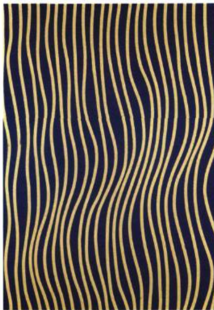
Bas du fleuve, Le Bic, 1964 Acrylique sur toile, 203,6 X 152,7 cm Musée des beaux-arts du Canada

D'emblée, les œuvres présentées frappent par leur dynamisme; pas étonnant que l'on ait souvent considéré Barbeau comme le peintre automatiste dont les créations s'agitent le plus. Qu'elles appartiennent à l'abstraction gestuelle, au op'art ou au courant néo-plasticien, ses compositions fluides aux lignes souvent obliques traduisent toujours