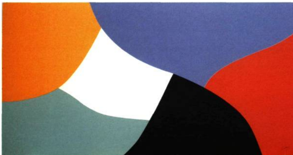
Étude pour la murale Laurentides, 1988 Acrylique sur toile, 188 X 137 cm Commande de Via Rail Collection Nancy Pencer