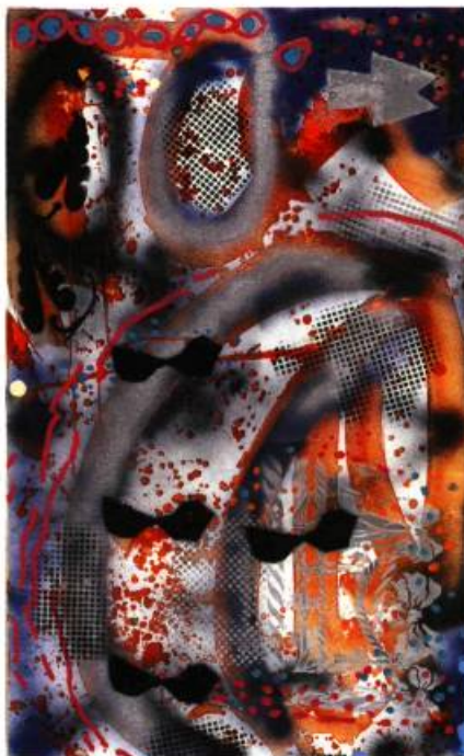
Demain l'an vingt mille, 1999 Acrylique sur toile, 76 x 122 cm

Les tableaux de l'exposition à la Galerie Bernard savent exercer une forte séduction esthétique leur permettant de traverser le rideau rationnel du spectateur pour atteindre son for intérieur. Soumis à leur vertu propre, ils défient toute analyse et réussissent l'immense défi d'amalgame le caché et le visible. □