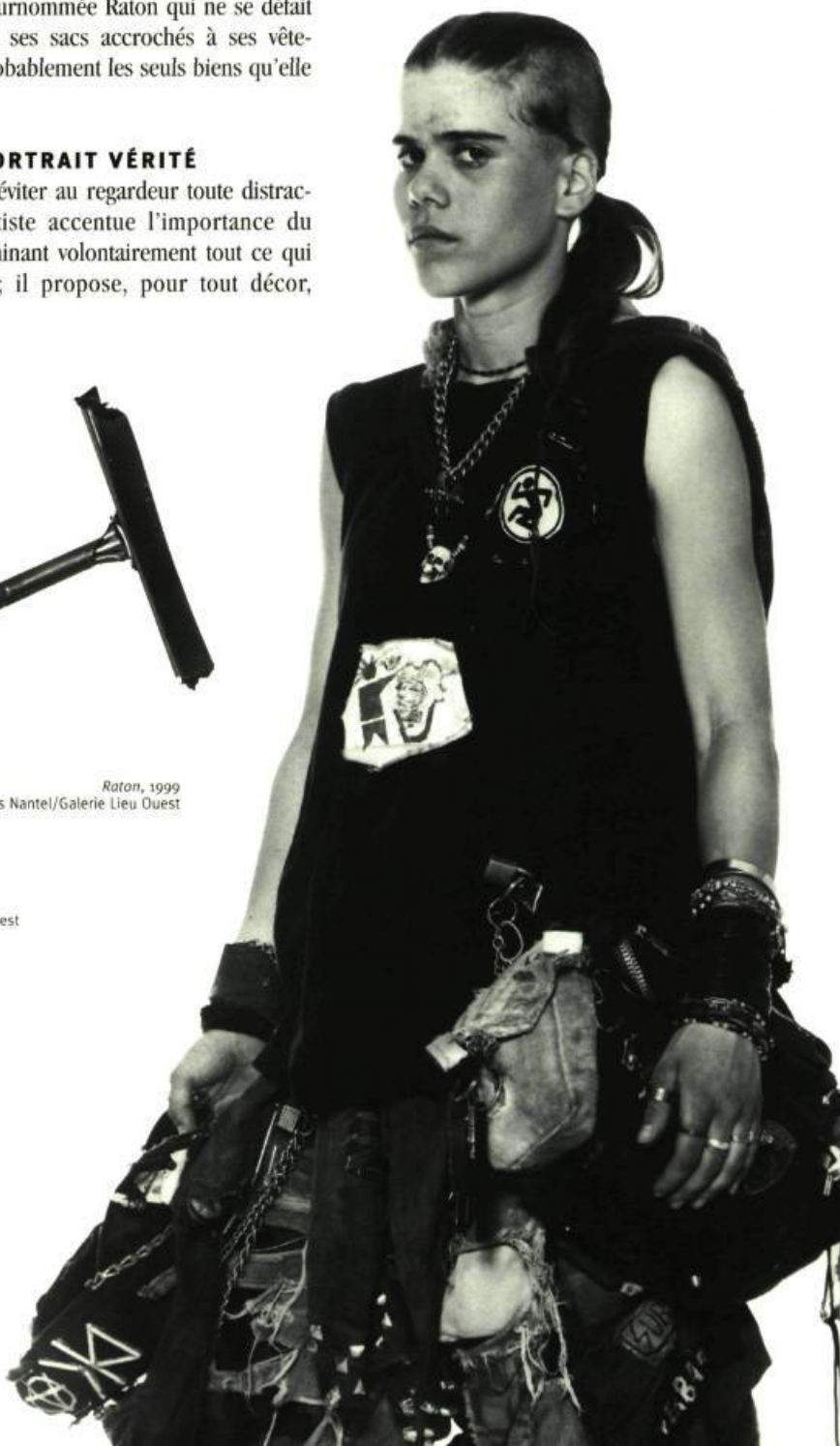
Raton, 1999 © Yves Nantel/Galerie Lieu Ouest