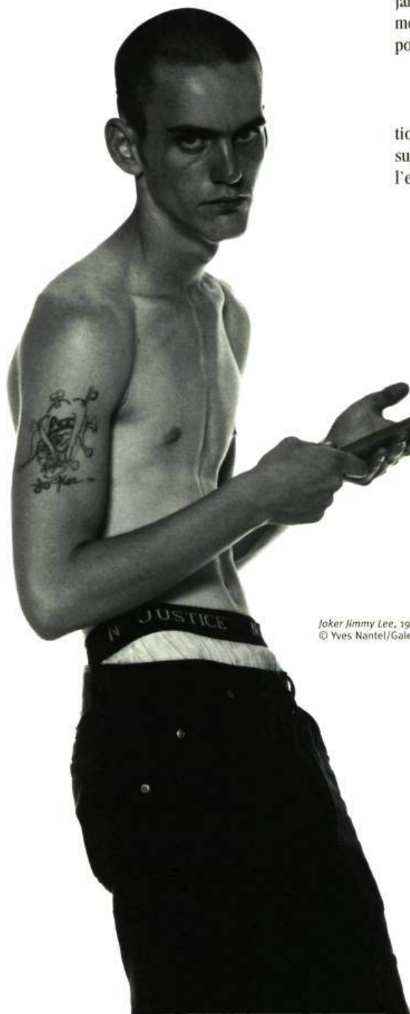
Joker Jimmy Lee, 1999 © Yves Nantel/Galerie Lieu Ouest

Afin d'éviter au regardeur toute distraction, l'artiste accentue l'importance du sujet, éliminant volontairement tout ce qui l'entoure ; il propose, pour tout décor,