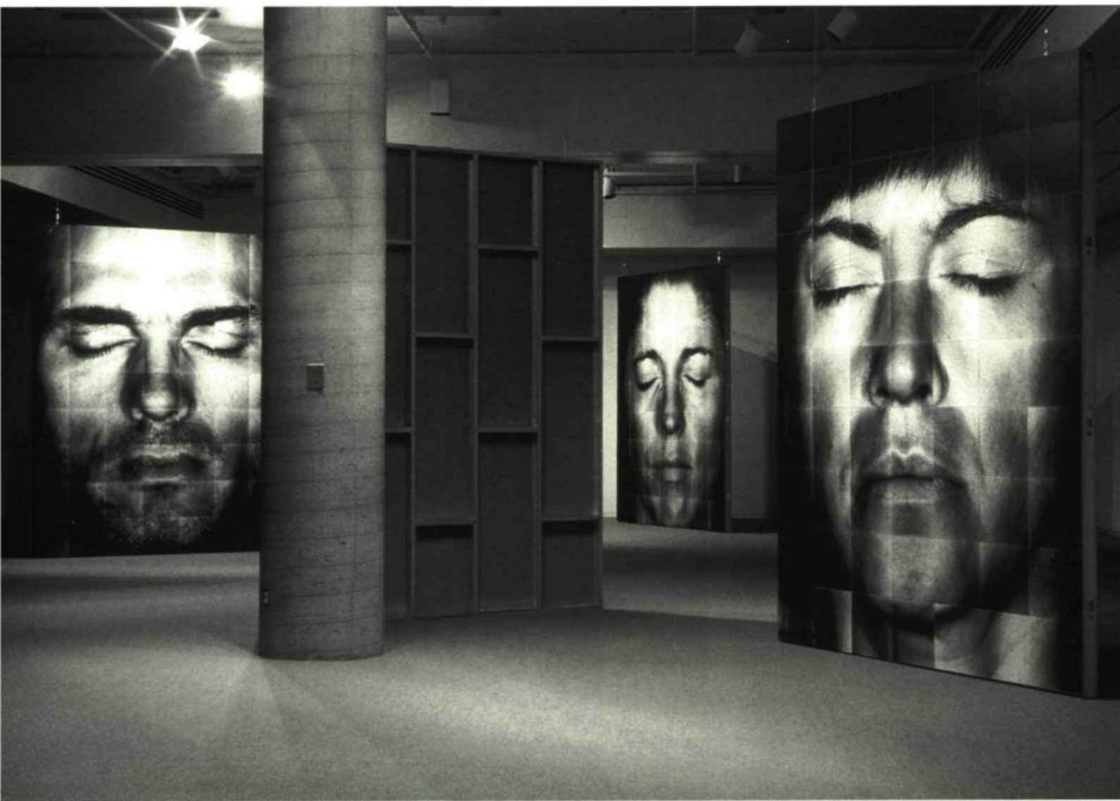
Série Les Écorchés, 1999 Galerie de l'UQAM

L ES RÉCENTS TRAVAUX DU PHOTOGRAPHE POUSSENT L'OBSERVATION ANATOMIQUE VERS DES DIMENSIONS ET PARAMÈTRES INÉGALÉS. SIMULATION OU DÉMESURE ?