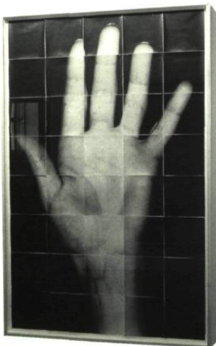
Quarante instants , 1998 Papier baryté, carton, bois, épingles à spécimen, 184 x 122 cm Galerie de l'UQAM

résulte 63 prises de vues représentant autant de négatifs. Réunies et assemblées, les photographies imprimées forment une mosaïque à grande échelle de la figure des modèles. Pour imiter l'effet de miroir, le photographe crée une deuxième figure à partir des négatifs inversés. Ce qui nous est donné à voir, c'est la reconstitution détaillée des parties de l'anatomie des visages formant par la suite un ensemble imposant mesurant plus de trois mètres de hauteur. L'artiste a littéralement balayé (scanned) la morphogénèse de la figure humaine rendant perceptibles des éléments que l'œil nu ne peut voir. La précision extrême du détail des fragments de peau grossis engendre la représentation d'un sujet plus vrai que nature comme si on avait voulu l'examiner sous la loupe de la lentille de l'appareil. Sommes-nous en présence d'une réalité simulée, d'irréalité ou même d'hyperréalisme ? C'est comme si c'était tout cela à la fois tellement le visage humain est révélé sous une apparence inhabituelle, que seule la méthode inductive de Pellegrinuzzi a permis de constituer. Les Écorchés nous offre donc un bel exemple d'une démarche artistique raisonnée entraînant et statuant une perception nouvelle de l'anatomie humaine.