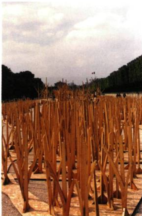
Pierre Thibault Forêt reconstituée (vue de jour, vue de nuit)

Comme son titre le suggère, l'installation architecturale de Thibault évoque une séquence ordonnée d'habitats. Comme chez Derouin, l'œuvre invite le spectateur au déplacement. De l'habitat des Inuits, on passe à la toundra, puis à la taïga. Ici, on évolue au sein d'une imposante forêt reconstituée. Les arbres de contreplaqué grandissent à mesure que l'on marche plus avant. Ils atteignent enfin une grande taille: c'est l'érablière. Des seaux métalliques sont accrochés aux troncs; ces éléments visuels seront repris dans les habitats suivants.