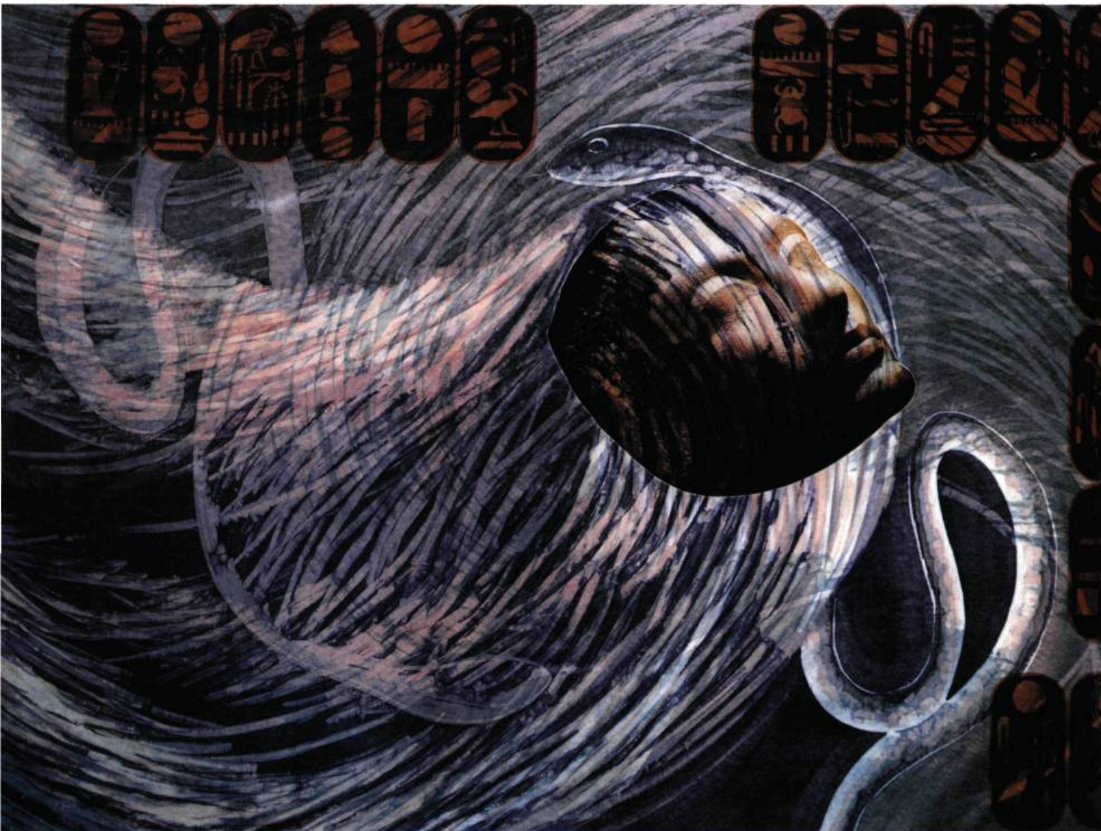
Nefertiti Xylographie couleur, collage xéros, 1996 95,5 x 114 cm

FRANCINE BEAUVAIS INTERROGE L'ORDRE CACHÉ DE L'ART.