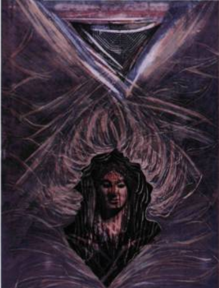
Kore Xylographie couleur, collage xéros, 1996 70 x 100 cm

Autour des figures emblématiques qu'elle a sélectionnées, l'artiste dégage tout un réseau de ramifications et de significations. Elle favorise la cohésion interne de ses compositions