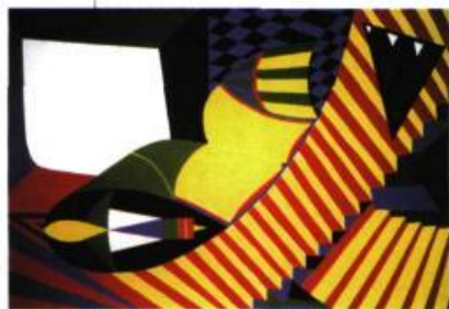
Compassion, 1999 Acrylique sur toile 60,5 x 91 cm

MIMA MAZHARI Galerie des arts contemporains 2165, rue Crescent, Montréal Du 20 mars au 20 avril 1999