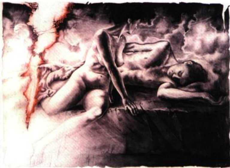
Lilith quittant le lit d'Adam, 1996 graphite, acrylique sur papier 56 x 76 cm

est la principale source d'inspiration de la série de tableaux qu'expose Lilian Broca à la Galerie de l'Université Concordia. L'artiste présente dans la veine symboliste des images métaphoriques de l'éternelle attirance et concurrence homme-femme, et la figure mythique d'une humanité incarnée par une femme.