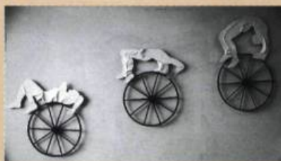
The Wheel , triptych, painted construction (29 po. X 29 po.) (29 po. X 25 po.) (36 po. X 22 po.)