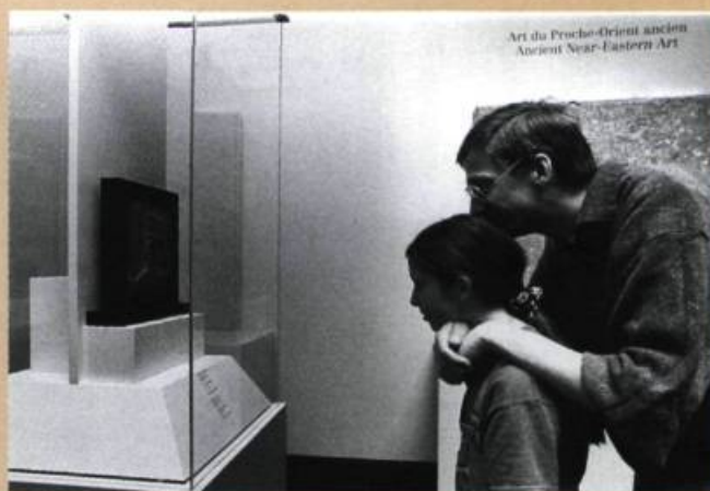
Journée des musées montréalais