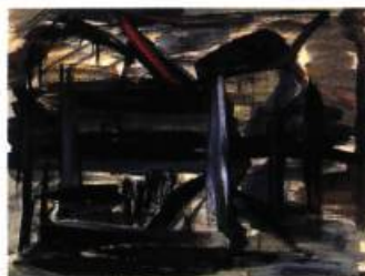
Fernand Leduc Île de Ré , 1950 Dessin : encre, gouache et pastel sur papier, 34,5 X 26 cm.

Réservez votre billet à un de ces numéros: à Montréal, (514) 527-8653, à Québec, (418) 683-5533 et à Sherbrooke, (819) 821-4411.