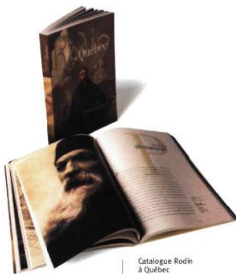
Catalogue Rodin à Québec

À voir jusqu'au 1 er mai. Galerie Simon Blais, 4521, rue Clark, Montréal. Tél.: (514) 849-1165