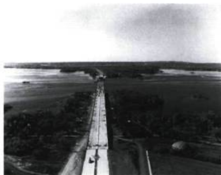
Construction du pont de l'Île-aux-Tourtres, autoroute 40 (6 octobre 1964).

Dans son dernier rapport annuel, le Conseil des Arts du Canada souligne la venue de nouveaux fonds qui, à la suite d'une décision du gouvernement fédéral, devraient augmenter annuellement de 25 millions de dollars et ce, pour les quatre prochaines années. En 1997-98, le Conseil a accordé 4593 subventions aux artistes et organismes professionnels de tout le pays. Quelque 17 349 000$ ont été accordés aux créateurs et 76 273 000$ aux organismes artistiques. Le rapport peut être consulté sur le site «www.conseilarts.ca».