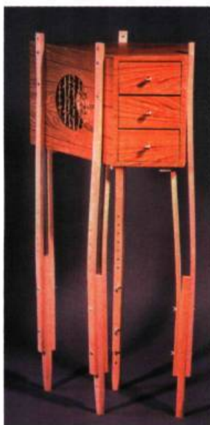
Meuble pour un religieux; Georges-Marie, 1998. Bois et autres matériaux, 100 X 30 X 50 cm.

(Des meubles pour Alice, Maison de la Culture Mercier, jusqu'au 11 avril).