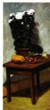
Goodridge Roberts Nature morte, 1948 Coll. Musée du Québec

Musée des beaux-arts de Montréal Du 1 er avril au 13 juin 1999