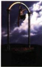
Gérard Bélanger L'Arc-En-Ciel, (détail) 1998 Bronze hauteur: 44 cm, largeur: 33 cm, profondeur: 20 cm.