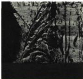
Don Maynard Wave Mixed media 30,48 x 31,60 cm