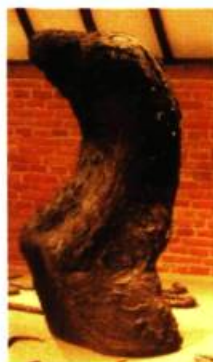
Yves Louis-Seize, Québec Surgissement de l'indifférence Installation extérieure Céramique, acier