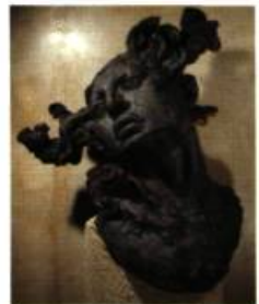
Javier Marin, Mexique Cabeza negra Céramique 1,29 m x 1,20 m x 0,75 m