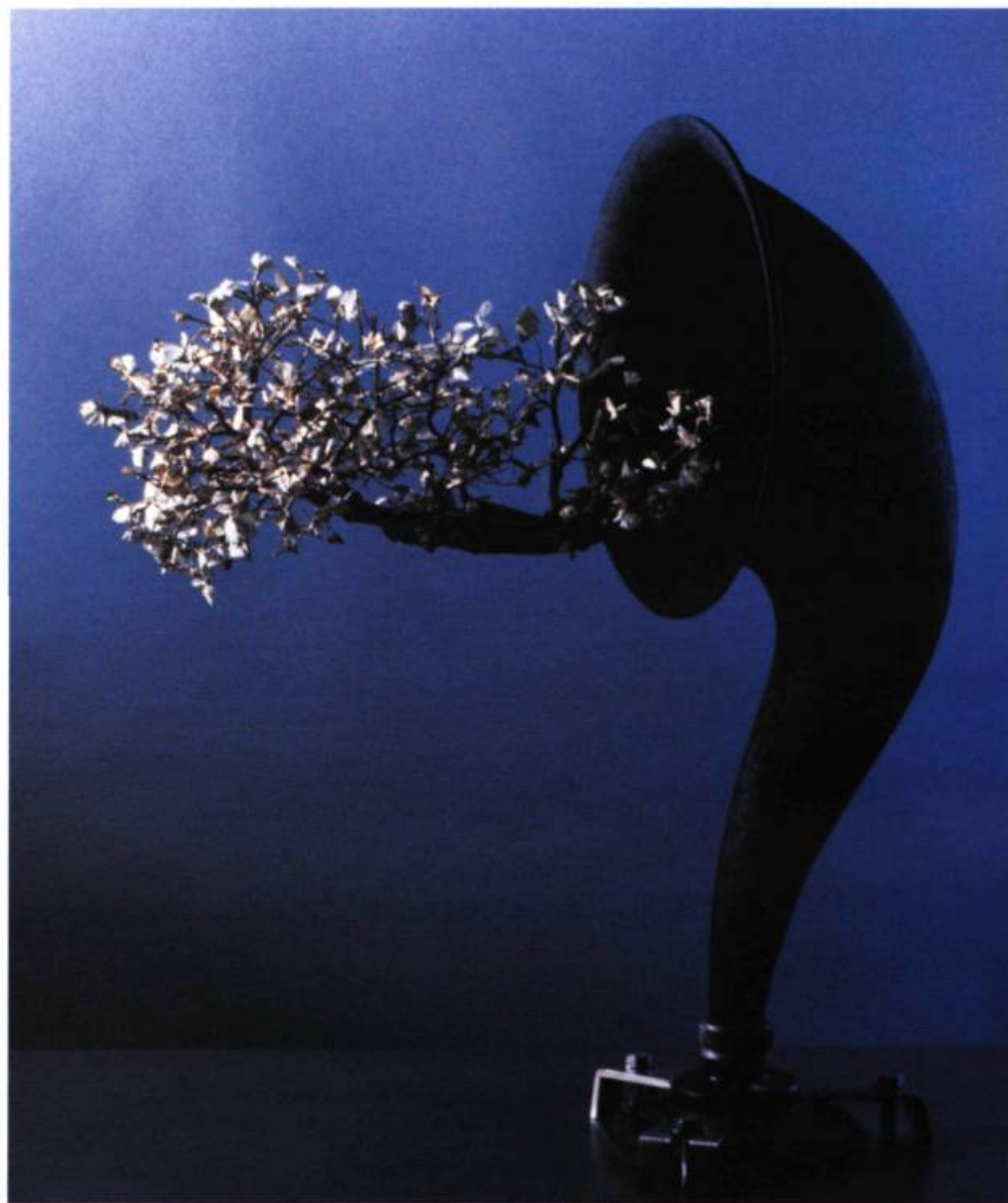
Pavillon de radio, bosai d'orme et papillons de nuit

Avant de faire les œuvres, Widgery a dû apprendre le langage d'un conservateur de collections, étudier la collection, choisir les objets pertinents ou inhabituels de notre héritage culturel matériel. Son intuition l'amena à transformer ces éléments afin de faire surgir chez le public des réponses