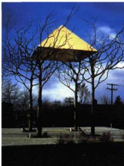
Le Vent se lève Sculpture École des Hautes Études Commerciales de Montréal

d'enregistrer, d'examiner et d'expliquer toutes choses? L'artéfact muséal, qu'il soit un objet culturel ou un spécimen naturel, est collectionné pour donner un sens à l'histoire mais le voilà maintenant transformé en vestiges d'un langage perdu dont les significations premières sont compréhensibles bien qu'elles soient obscures. Notre civilisation se trouve dans un cul-de-sac : il semble vain d'essayer de redéfinir le sens du progrès à une époque où l'état de notre planète est menacée. On peut voir un jeu