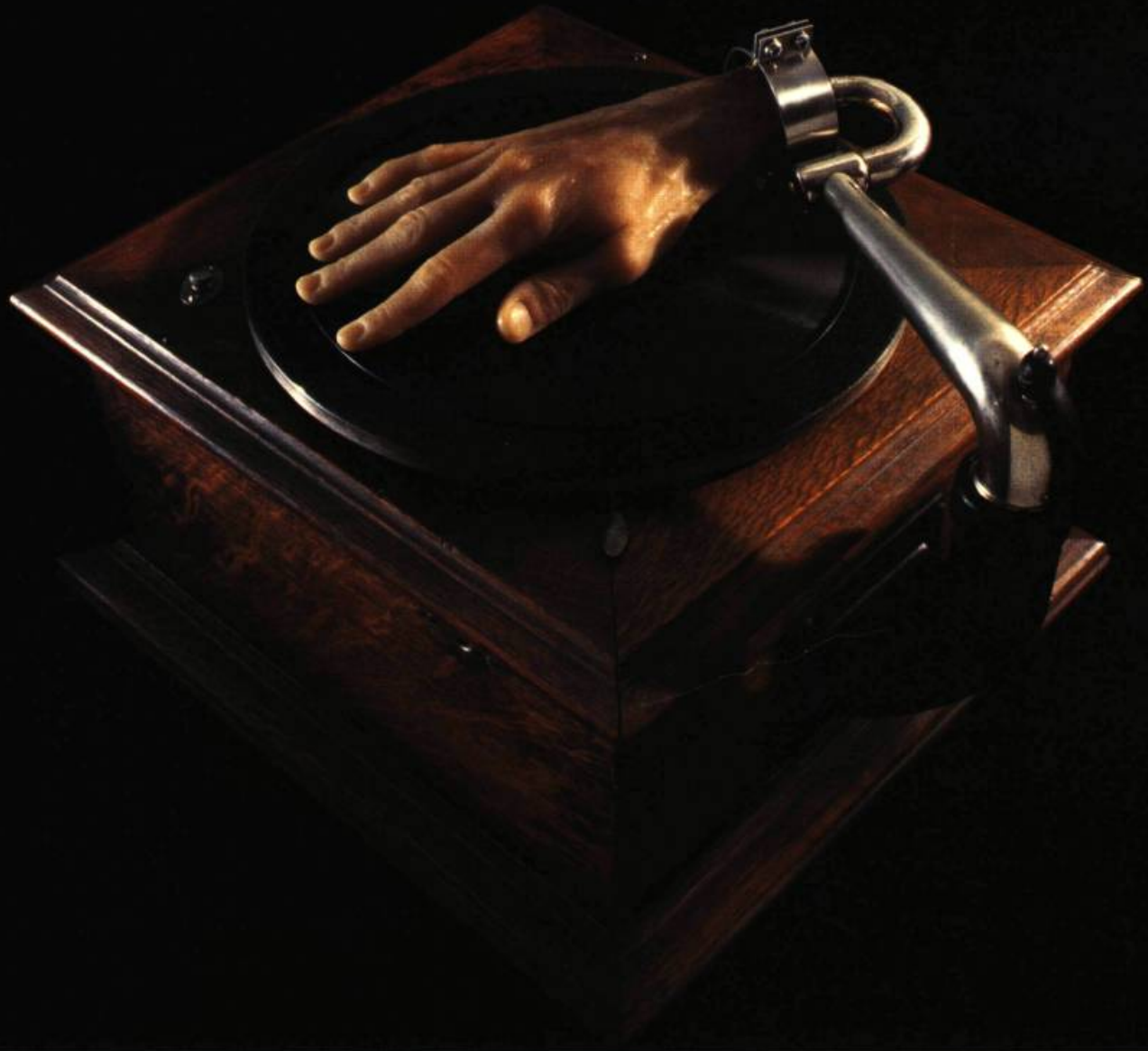
Main de cire et phonographe

T ELS DES POÈMES SURREALISTES, LES ASSEMBLAGES DE CATHERINE WIDGERY JUXTAPOSENT DES OBJETS MUSÉAUX À DES ÉLÉMENTS NATURELS