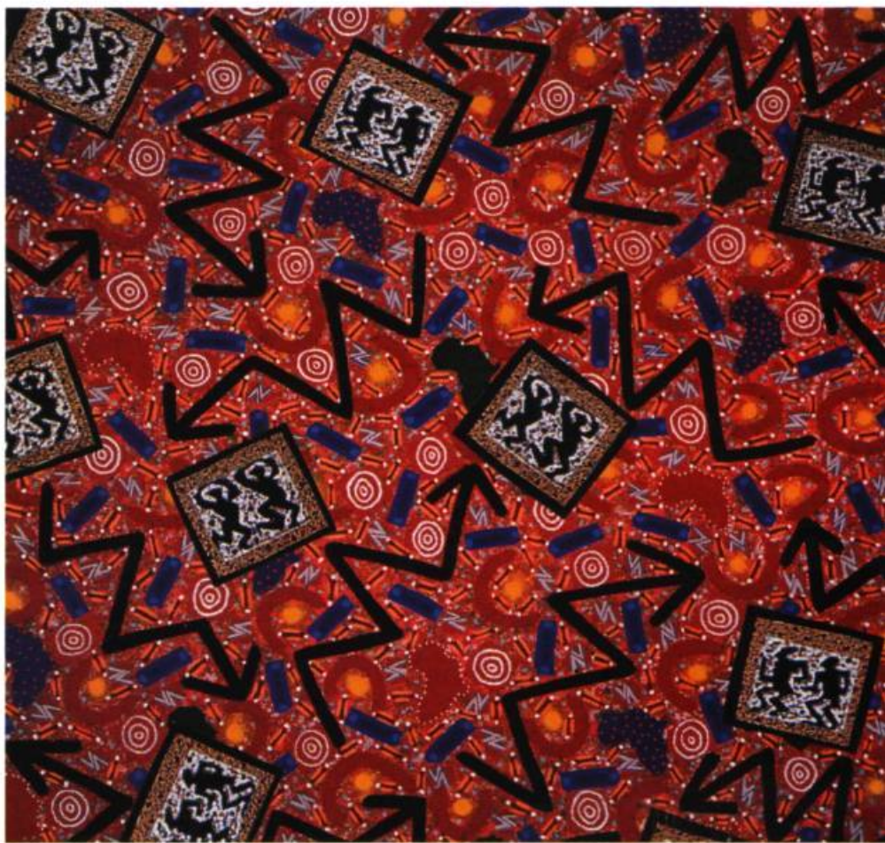
Maquette pour une estampe pour le festival de jazz, 1998.

Mais, qu'on ne s'y trompe pas; le qui-proquo est tel que la dérive de l'image du reptile devient très rapidement, comme le titre d'une œuvre le suggère, la balade des