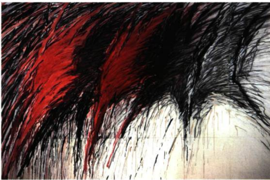
Tamiami Acrylique et fusain sur toile, 1976 244 x 366 m Banque d'œuvres d'art du Conseil des arts du Canada