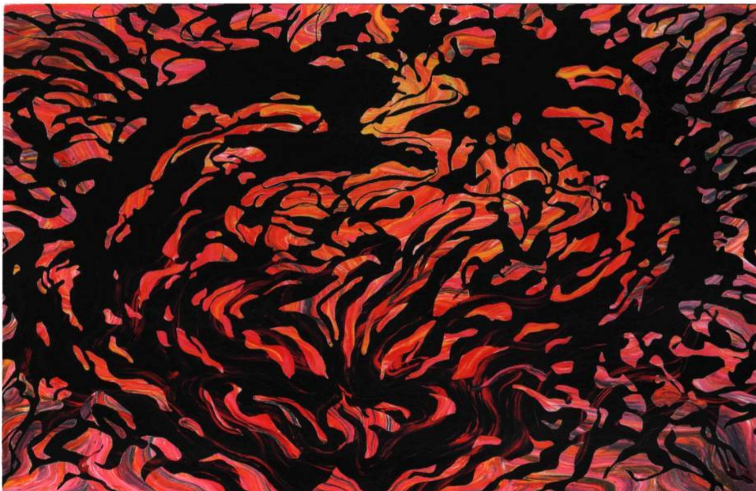
Griffonfou noir Acrylique sur toile, 1997 135 x 216 cm

désordre, le hasard et la loi font bon ménage et se font la lutte dans le même moment.