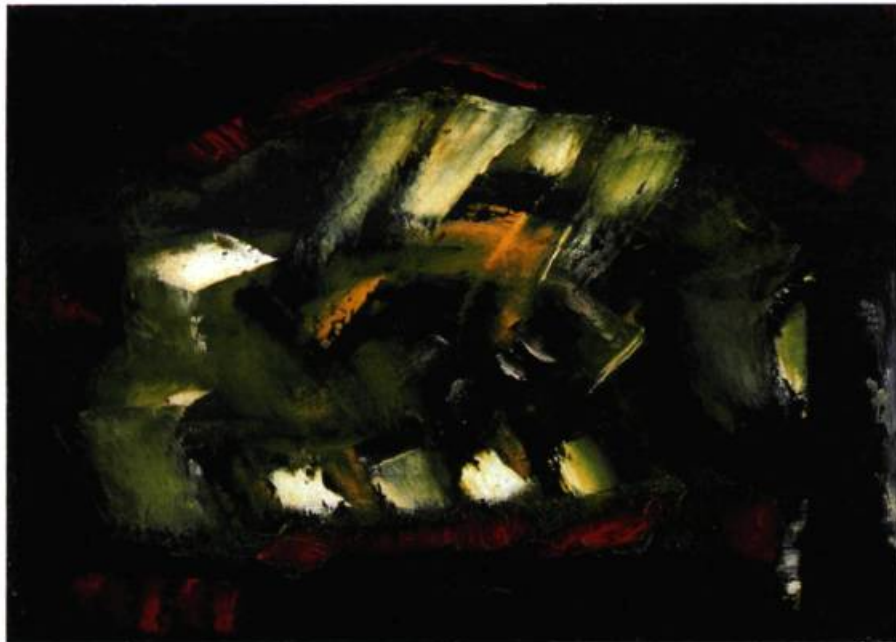
Paul-Émile Borduas Abstraction verte , 1941 Huile sur toile, 26 x 36 cm Musée des beaux-arts de Montréal Acquisition de la collection Renée Borduas Cette œuvre serait la première composition abstraite de Paul-Émile Borduas

IMPOSSIBLE » DE L'IGNORER OU DE FAIRE SEMBLANT QUE LES CHOSSES POUVAIENT CONTINUER COMME AVANT.