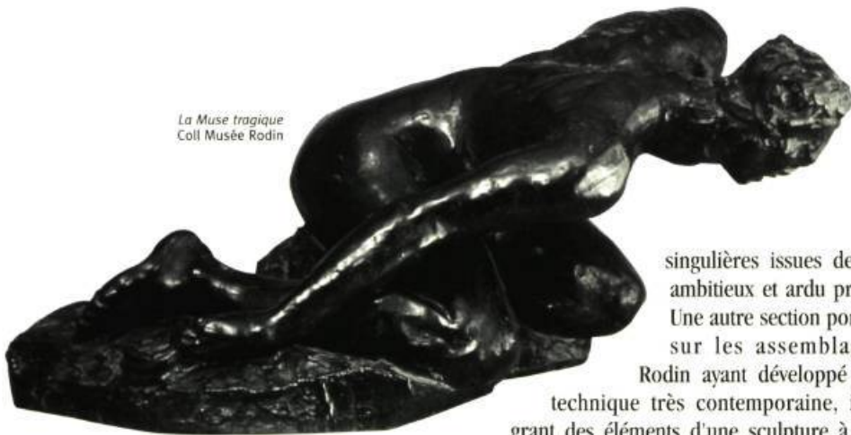
La Muse tragique Coll Musée Rodin

La lecture sera plurielle, avec des mises en contexte importantes. De la sorte, les visiteurs auront plusieurs corridors d'accès à l'exposition. Ils découvriront dans un premier temps les « must » de Rodin: Le Baiser , œuvre fétiche des amoureux, Le Penseur (dans le format original conçu par le sculpteur et acheté en 1909 par le Musée des beaux-arts de Montréal), Les Bourgeois de Calais , qui renouvelle l'image du sacrifice patriotique (maquette en bronze et figures individuelles), L'âge d'airain (un prêt exceptionnel du Musée des beaux-arts du Canada pour un tirage ancien de l'époque de Rodin). Rappelons que cette dernière œuvre