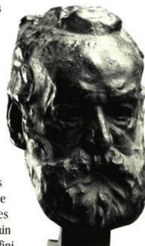
Tête de Victor Hugo Musée du Québec

nous ne mesurons plus l'impact du sculpteur sur le public de son époque. Ses contemporains ont longtemps été choqués par ces figures aux membres tronqués, réactualisations des statues antiques mutilées; par ces musculatures modelées de manière expressive, éloignées de l'idéal gréco-romain et de la tradition du fini et du poli; par ces poses empreintes de spontanéité, perçues comme autant de dérogations aux attitudes réglementées; par ces innovations plastiques incessantes, qui bouleversent les critères d'appréciation esthétique. L'exposition du Musée du Québec relèvera donc le défi d'offrir un raccourci d'histoire de l'art permettant de mesurer les sauts considérables que Rodin a fait vivre à la sculpture telle que pratiquée en France à la fin du XIX e siècle. □