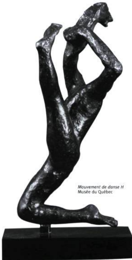
Mouvement de danse H Musée du Québec