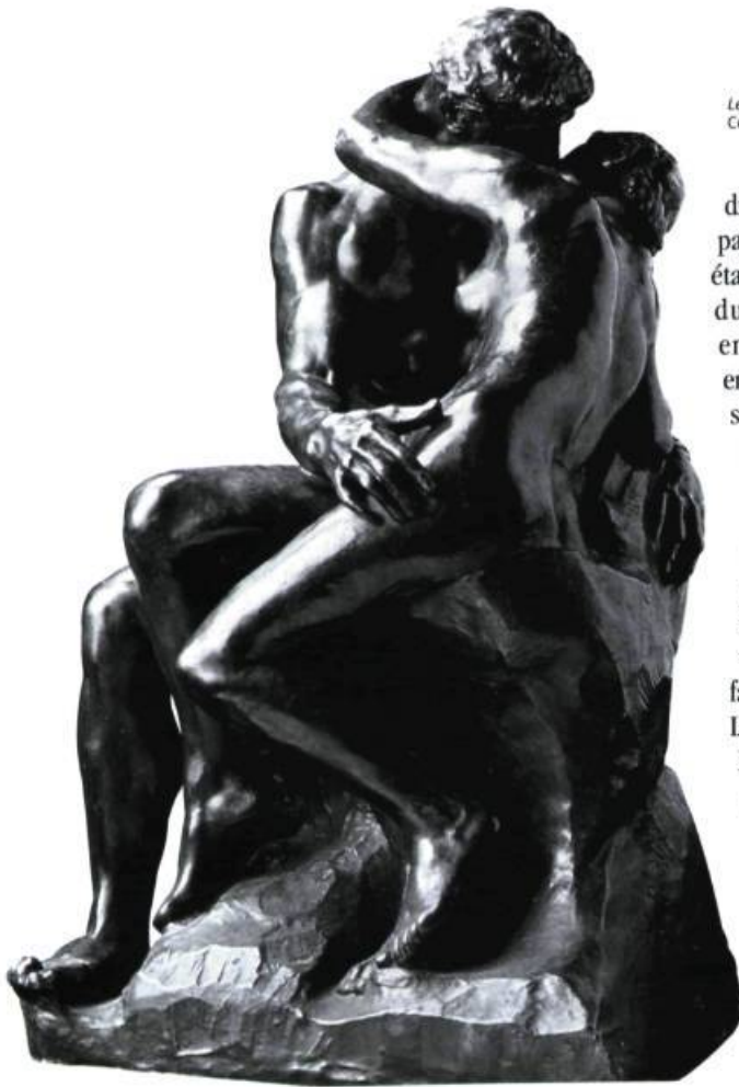
Le baiser Coll. Musée Rodin

disponibilité des pièces n'était pas possible avant 1998. » Cela était loin de rebuter l'équipe du Musée du Québec qui, enchantée par la réponse, entreprend un véritable processus d'échange et de partenariat avec le musée Rodin. « L'exposition a vraiment été bâtie par les deux institutions, assure M. Porter. Elle n'est donc pas, comme on dit dans le jargon du métier, une « valise » qui nous arrive toute faite, clés en main. »