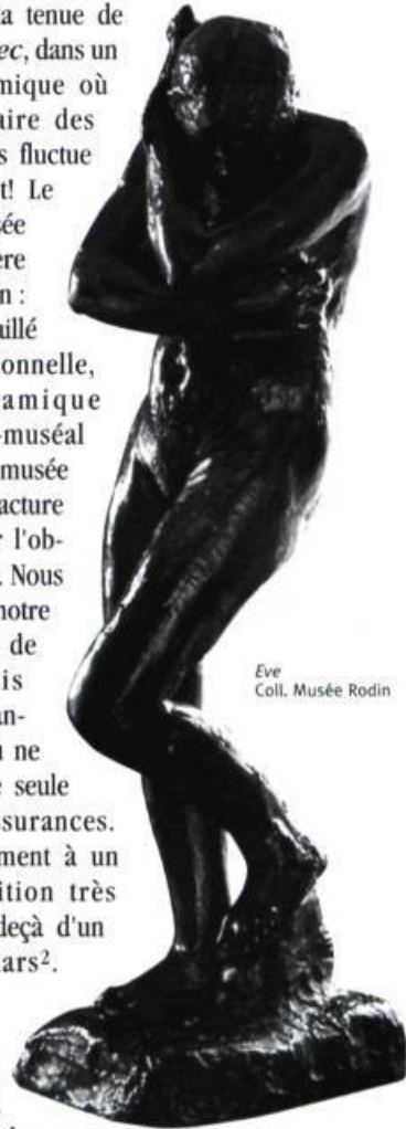
Eve