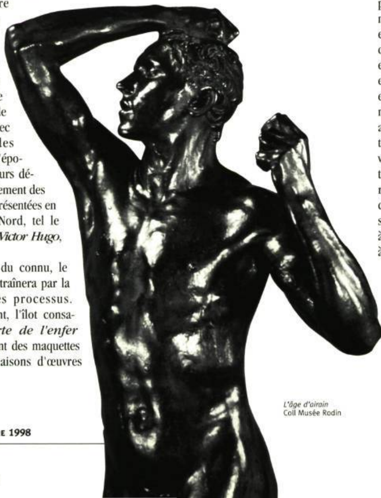
L'âge d'airain Coll Musée Rodin

EXPOSITION MUSÉE DU QUÉBEC 4 JUIN AU 6 SEPTEMBRE 1998