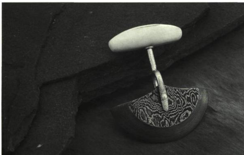
Couteau Bécassine Manche en argent et or 18k Lame en acier ats 34, 1997 15 cm

Longtemps tiraillée entre l'enseignement et la création, l'orfèvre-coutelière a choisi de privilégier dorénavant sa nouvelle passion. Ravis, les collectionneurs l'attendent de pied ferme. □