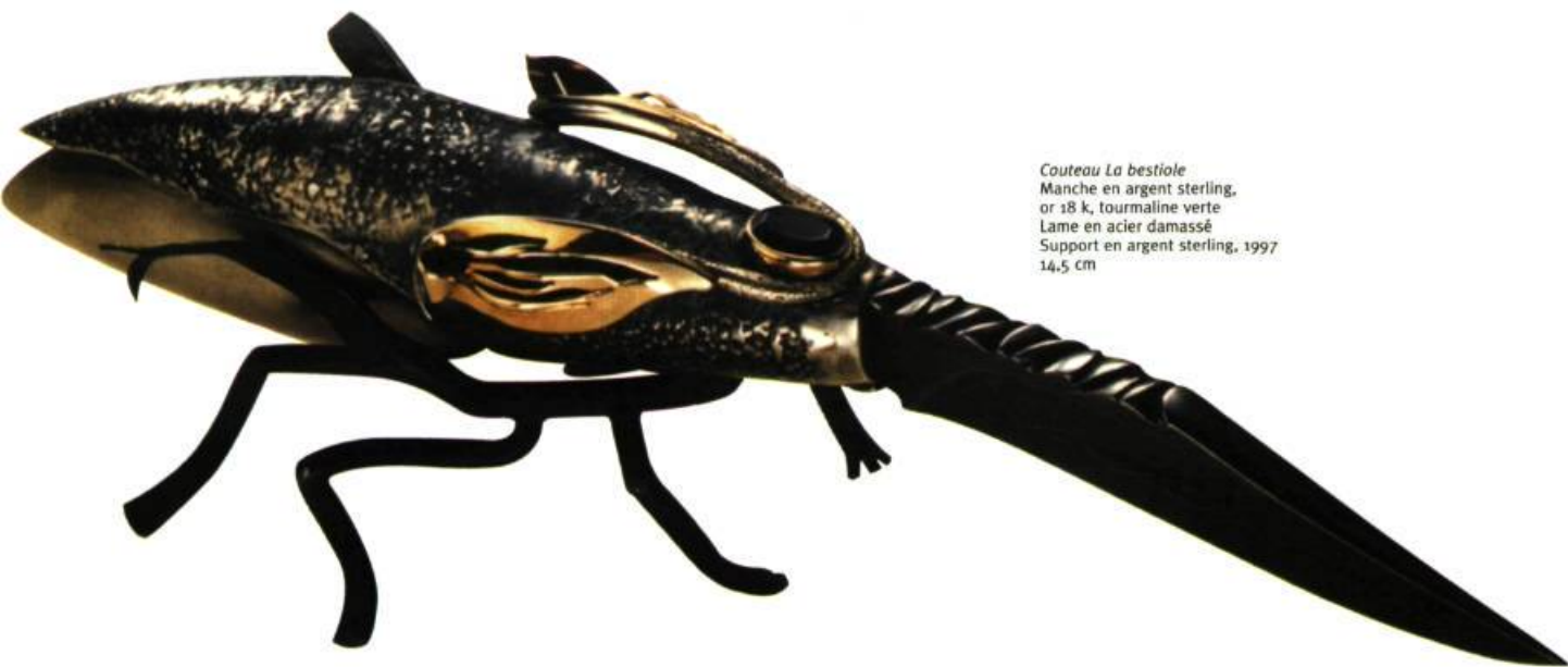
Couteau La bestiole Manche en argent sterling, or 18 k, tourmaline verte Lame en acier damassé Support en argent sterling, 1997 14,5 cm