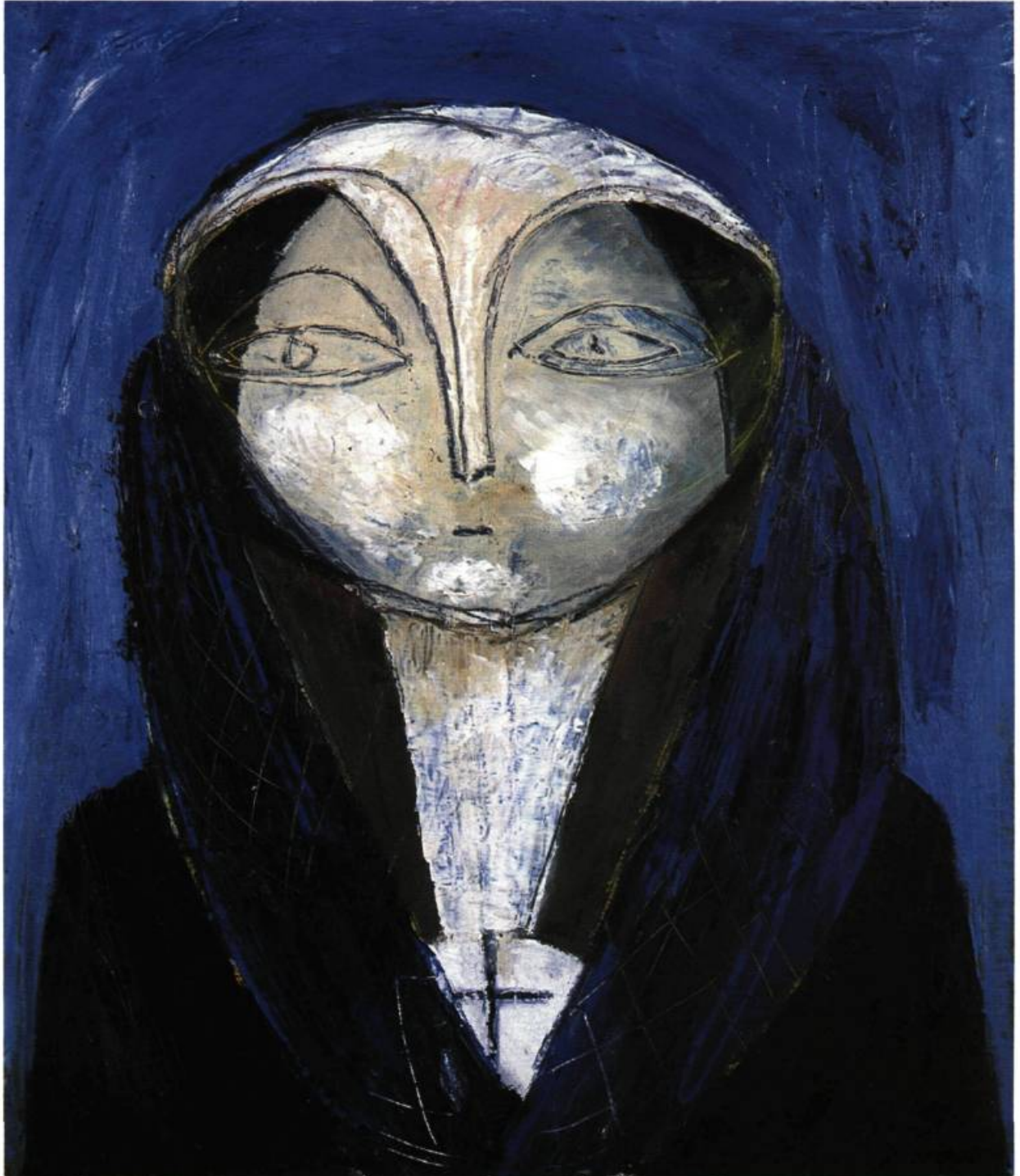
Blanche de la force 1957 Huile sur toile 71,5 x 61,5 cm