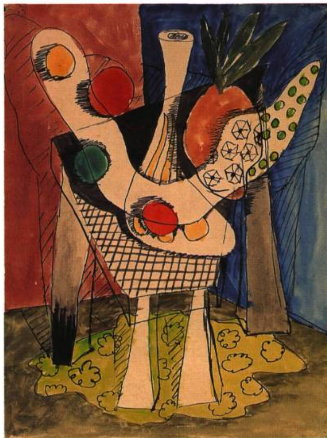
Nature morte, 1947 gouache 30 x 23 cm

liste. Le second groupe prolonge un expressionnisme abstrait proprement structural jusque dans la période la plus actuelle, 95-98. S'agissant d'œuvres inconnues et inhabituelles, en deux dimensions, il devenait nécessaire de leur accorder un regard neuf dans un style neuf, pour bien faire émerger leur signification dans la démarche de Daudelin.