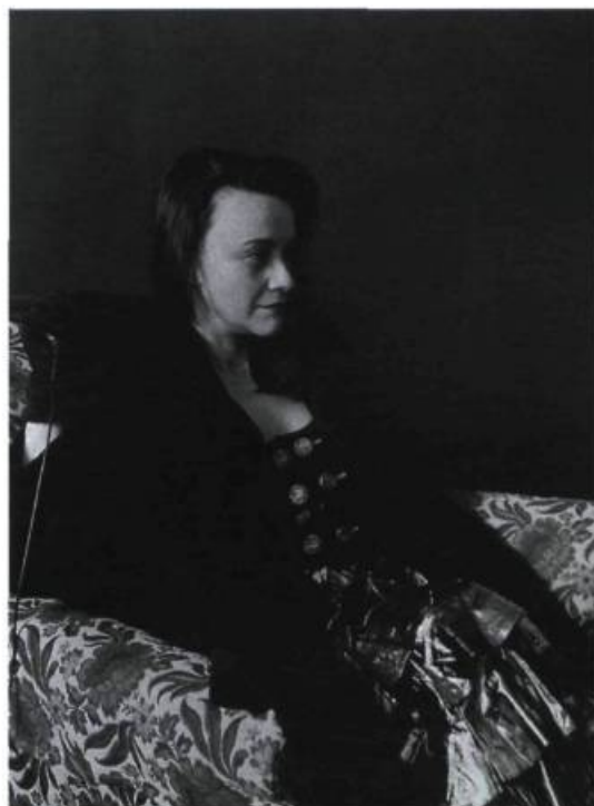
Détail de la première partie: 1,22 x 1,02 m

le portrait de soi, la lecture éblouissante du vertige d'un instant de soi. Le torrent de la vie qui giclé à travers l'arc de notre conscience dilatée par l'épuisement de la chair. Et sur l'image, la preuve du désir des autres comme autant de racines plantées dans sa propre chair. Noir sur blanc... La vie qui naît tous les jours, elle s'oublie au fur et à mesure. L'artiste l'imprime, elle reste.