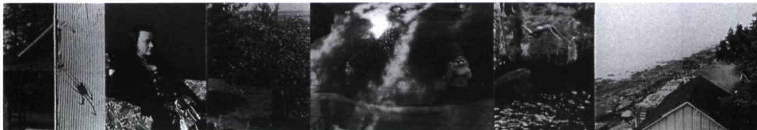
L'arrivée des figurants Première partie: six photos: 1,22 x 6,90 m

Qu'y a-t-il sur ces photos? Rien. Presque rien du détail de la vie ordinaire immobilisée, engluée dans des fragments de monde. Jamais rien d'entier. Rien, c'est-à-dire presque tout. L'infinie poésie de vivre... Partout le piétinement du bonheur de soi. Car c'est ça la nostalgie de l'autoportrait si fréquent chez April. Sous