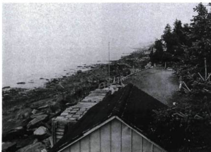
Détail de la première partie : 1,22 x 1,57 m

L'arrivée de quelques visages à la surface du monde, leurs regards sur les choses qui les entourent et nous entourent – ce sont les mêmes – voilà ce qui nous touche infiniment. Nous identifions à eux. Ces instants de matière, ces fragments de décisions, cet assemblage de lumière, ce qui est proposé de nous figurer ici, c'est simplement ceci : notre propre arrivée dans le défilé du monde... Que déciderons-nous d'être : acteurs ou figurants ? □