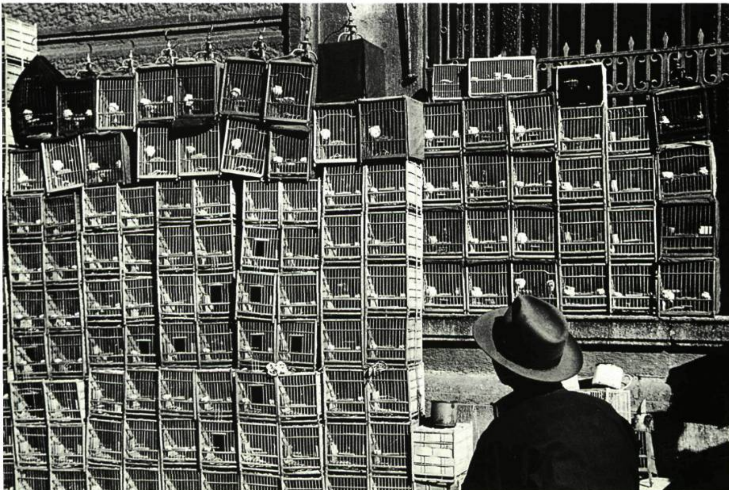
Bird Fancier, Shanghai, 1949 Epreuve argentique Collection du Musée d'art contemporain de Montréal