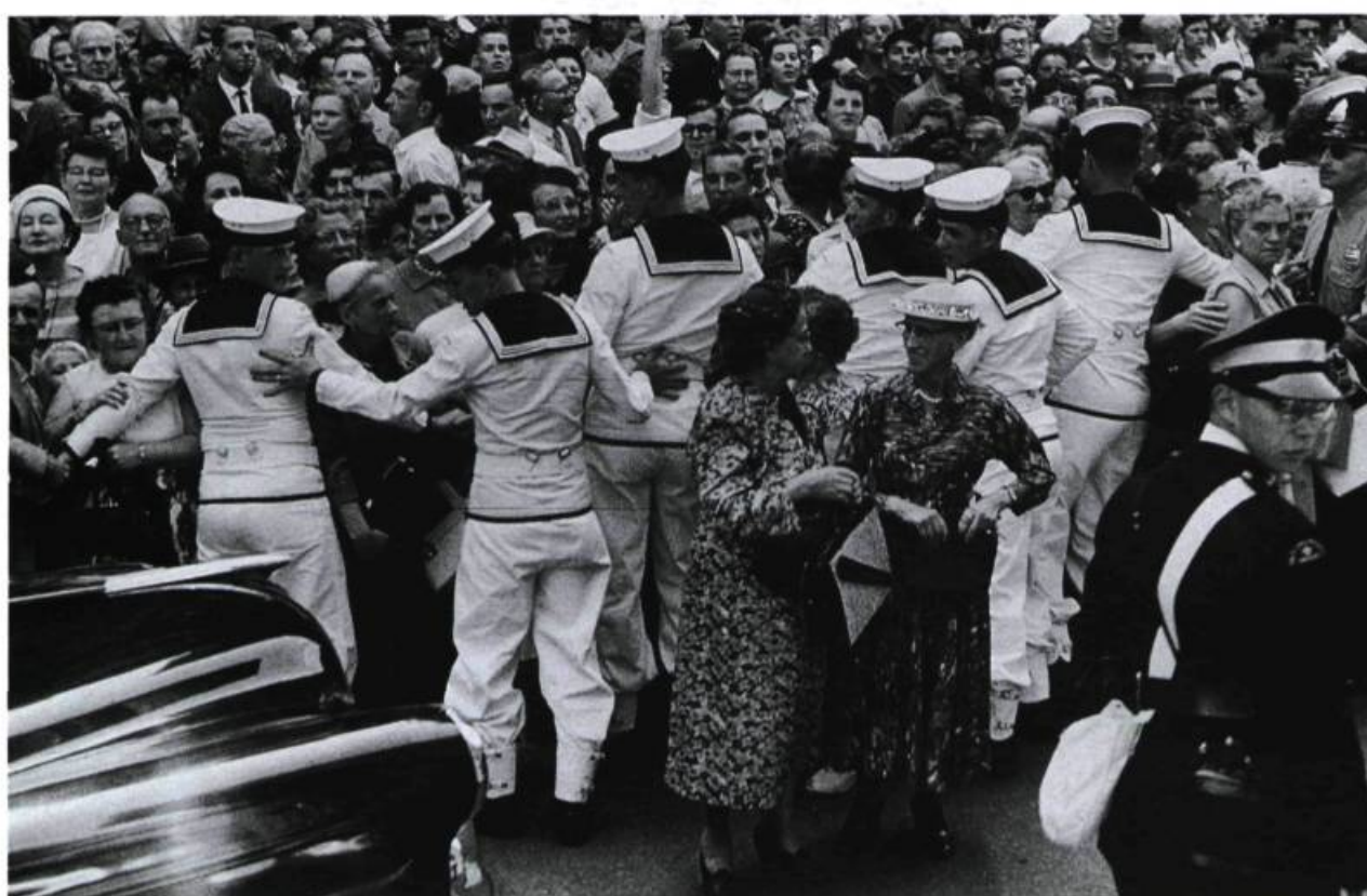
Visite royale, Montréal, 1959 Épreuve argentique