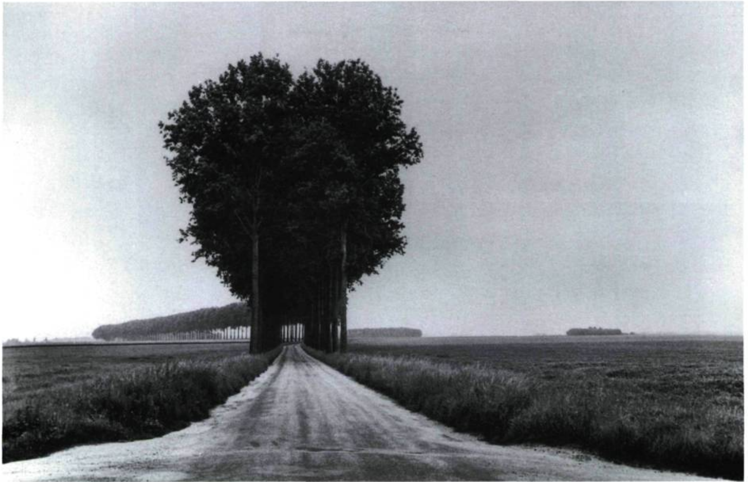
Brie, France, juin 1968 gélatine et épreuve d'argent

Quelle est la raison de la renommée du travail de Cartier-Bresson : le début du photo-reportage, l'anecdote, le contenu socio-psychologique, la composition ?