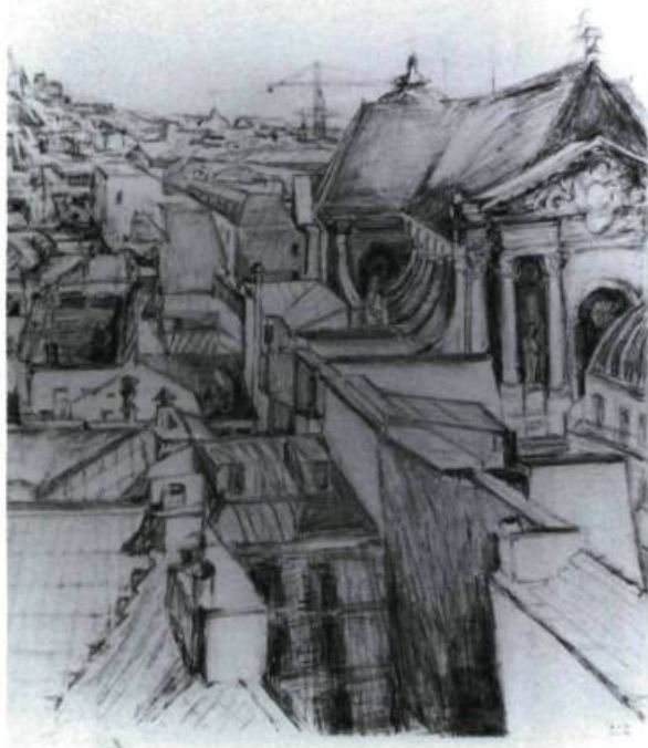
Église de Saint-Rock Dessin, 1976.

Ce découpage si particulier nous procure la présence d'une aura, « une trame singulière d'espace et de temps » 2 qui résonne en nous sans que l'on sache exactement pourquoi. Peut-être s'agit-il à la