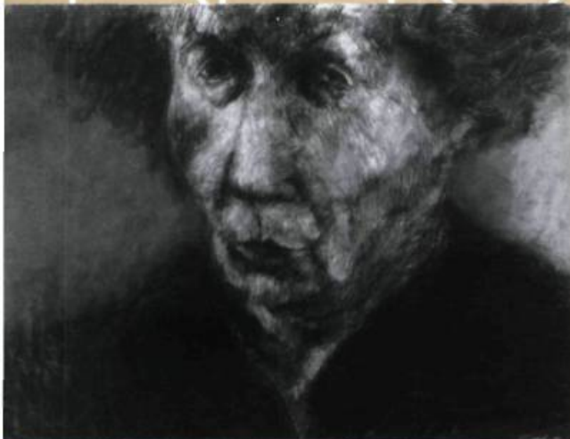
Georges Segal Helen, 1996