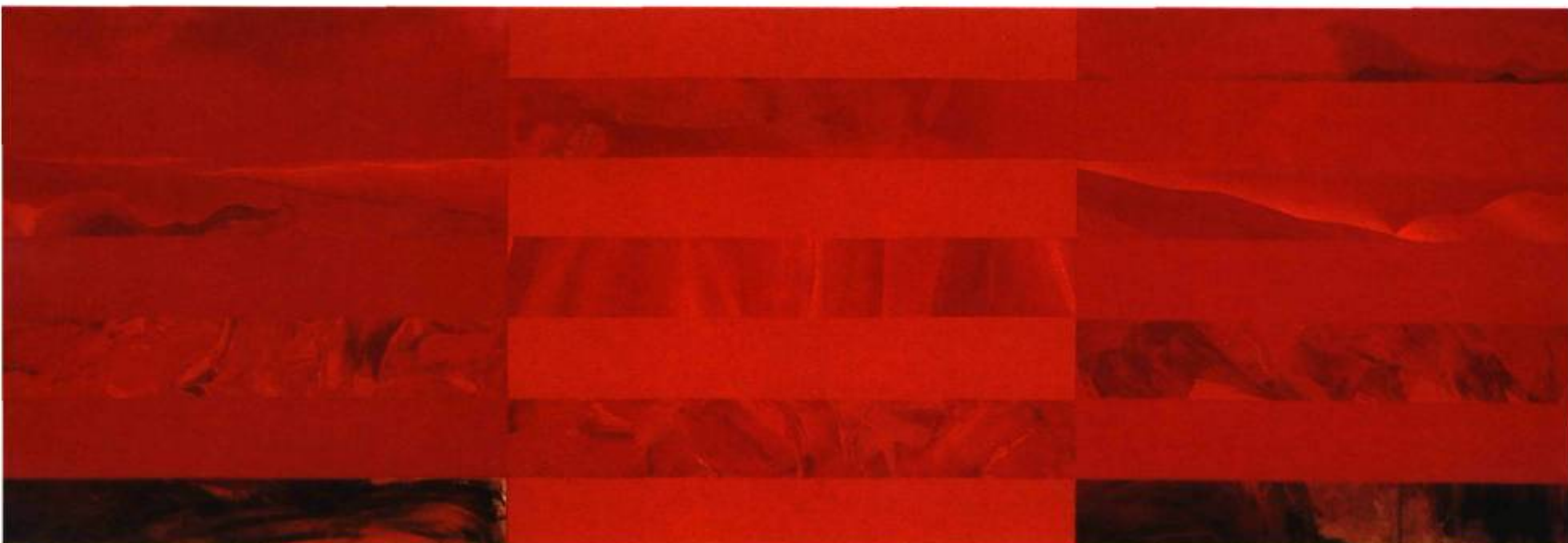
Écritures d'Elles, 1992 Techniques mixtes 76 x 229 cm

Céline Blais invite l'observateur à lire ses plans carrés ou rectangulaires, à suivre ses bandes horizontales, ses lignes obliques où naissent des triangles dans la rupture des dessins et l'évanescence des couleurs. L'artiste invite aussi l'observateur à décrypter l'en-dessous de la surface.