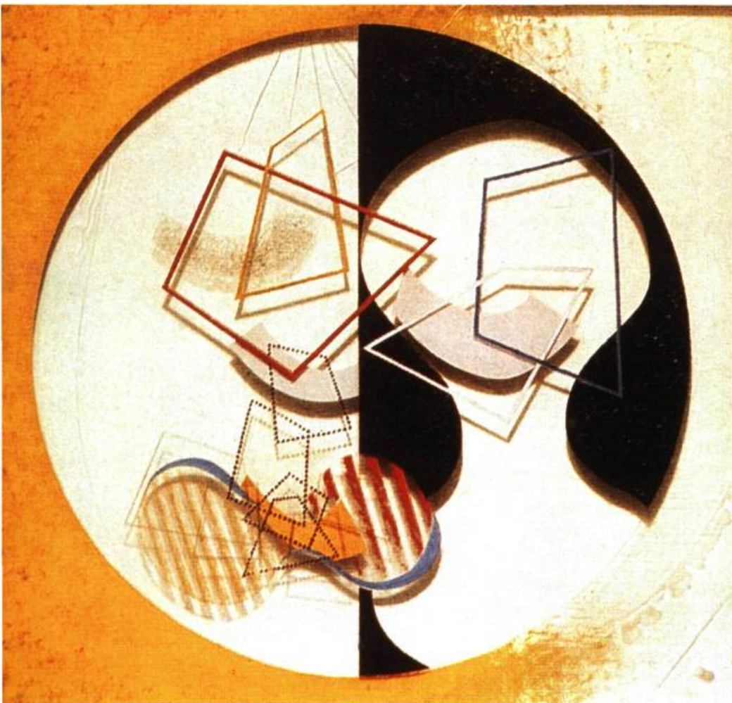
Laszlo Moholy-Nagy Space Modulator, 1939-45 Huile sur plâtre incisé.

Adolf Hitler, congrès du parti nazi, Nuremberg, 1935.