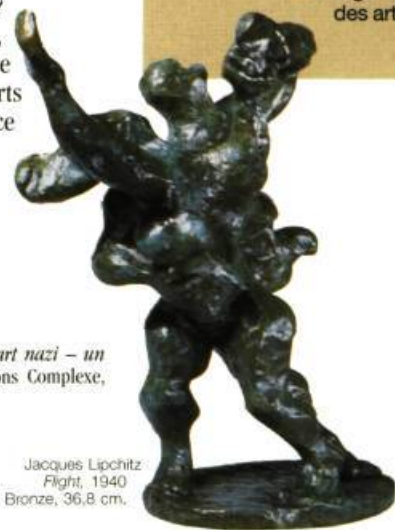
Jacques Lipchitz Flight, 1940 Bronze, 36,8 cm.

L'ouvrage s'achève sur une chronologie synoptique de la période 1933-1945 où l'on peut suivre en parallèle les événements politiques et culturels en regard des activités des artistes émigrés.