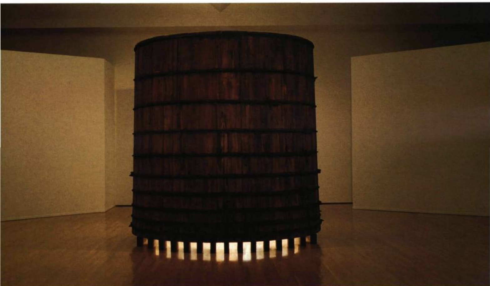
Château d'eau: lumière mythique, 1997 Bois de cèdre, métal, miroirs, défenses de narval en ivoire, moteur, lumière 320 x 305 cm (diamètre) Coll. de l'artiste

EXPOSITION Irene F. Whittome Musée d'art contemporain de Montréal Du 3 mai au 19 octobre 1997