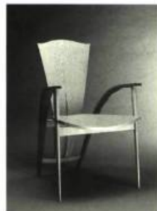
Chaise no 1 revue 1995 (conçue en 1992) Grèze et aluminium, 86 cm x 66 cm x 66 cm