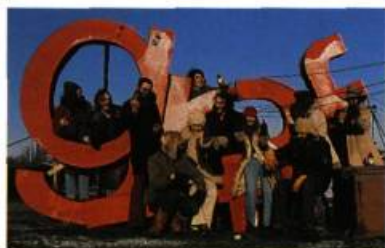
Lancement de Collection de l'Atelier , rue Marie-Anne en 1972.

En mai 1970, treize artistes de Graff exposent en Suisse, à la Galerie des nouveaux grands magasins de Lausanne. Ayot et Wolfe sont délégués pour représenter Graff et en profitent pour visiter des ateliers de gravure en Europe; démarche de découverte et de comparaison qui confirme l'importance de l'estampe québécoise.