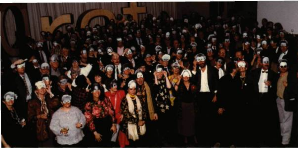
Vernissage de Graff, vingt ans (1966-1986), 1986 au Musée d'Art Contemporain de Montréal.