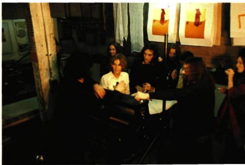
Le groupe Graff en 1966

En marchant vers l'atelier de Hannelore Storm (texte et images)