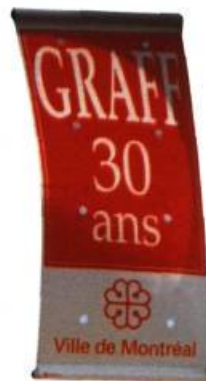
Exposition Avoir 30 ans... c'est Graff!