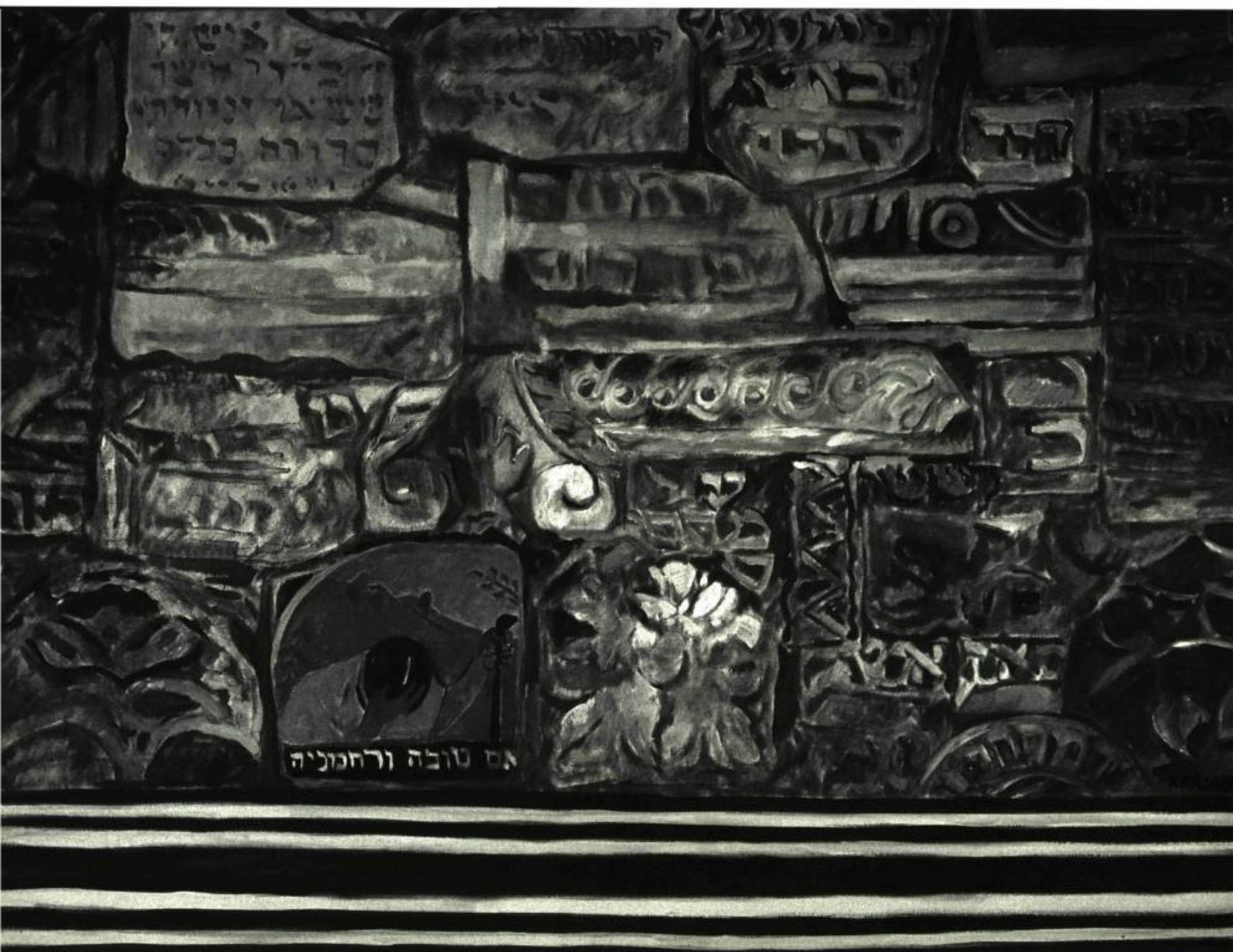
Fragments-Piéta, 1996 Huile sur toile, 101 X 76 cm