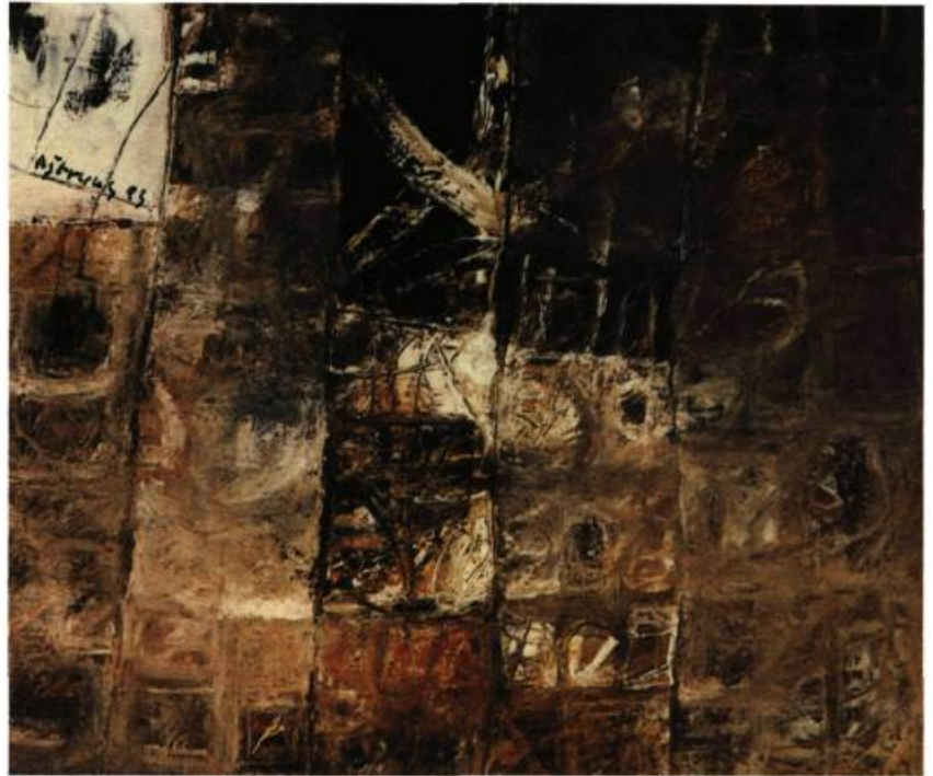
Nguyen Trung, Bâtiment , 1993 huile sur toile 120 x 120 cm

Les artistes vietnamiens contemporains les plus en vue ne récusent certes pas les techniques et les modes d'expression hérités d'une tradition multimillénaire. Ils intègrent les formes d'expression propres aux mouvements de l'art contemporain ; ils s'en démarquent néanmoins au point d'ouvrir un courant qui traduit des sensibilités originales reflètes du monde actuel. On peut en voir les résultats à l'occasion de biennales ou à la foire internationale Art Asia, à Hong Kong mais aussi à Montréal.