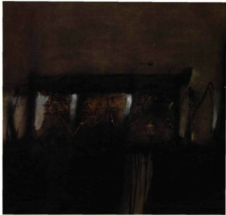
Do Hoang Tuong, Vestige 1 , 1995 acrylique et huile sur toile 100 x 100 cm

L'essor de la peinture à l'huile au Viêt-nam est associé à la création de l'École supérieure des Beaux-arts de l'Indochine, à Hanoï, en 1925. En effet, de 1925 à 1945, l'École supérieure a joué un rôle moteur dans la création d'une peinture vietnamienne, mais aussi dans son rapprochement avec la peinture européenne puisque son directeur, M. Victor Tardieu, avait étudié en compagnie de Matisse et de Rouault dans l'atelier de Gustave Moreau, le grand peintre symboliste du XIX e siècle.