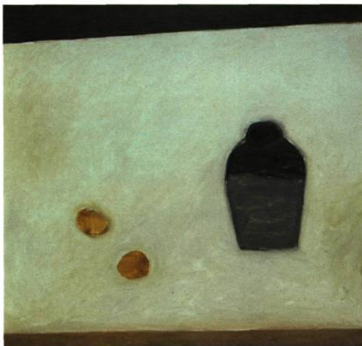
Viet Dung, Nature morte , 1995 huile sur toile 80 x 80 cm

Nguyen Xuan Tiep est certainement le plus important de cette nouvelle génération. Né en 1956, Tiep est diplômé du Collège des Beaux-arts de Hanoï. Depuis 1993, Tiep a participé à des expositions collectives à Hong Kong, Singapour et Djakarta, ainsi qu'à la Triennale de Brisbane, en Australie. Tiep est représentatif d'un courant artistique plus présent dans le Nord du pays où les racines demeurent vives. En effet, les thèmes de ses peintures s'inspirent souvent de ses souvenirs d'enfance à la campagne. Il y ajoute le monde de la spiritualité. « La combinaison des deux est ma façon, déclare-t-il, de juxtaposer le réel et le fantastique, le bien et le mal ». Il inclut également des éléments décoratifs architecturaux qui font référence à la culture du Viêt-nam, comme les pagodes, les temples. Ses œuvres récentes mettent en scène des chiens et les formes qu'ils peuvent prendre sous les reflets de la lumière. C'est sa manière