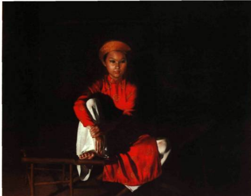
Do Quang Em, Assise sur une chaise de bambou , 1994 huile sur toile 86 x 100 cm

Cela peut être une vieille chaise comme dans Clair de lune , ou alors une référence à l'histoire collective vietnamienne.