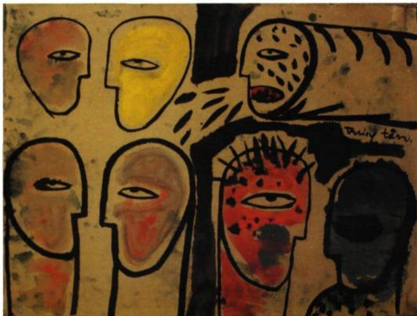
Truong Tan, Sans titre , 1993 gouache et encre de Chine sur papier de riz 55 x 75 cm

1 Pour pouvoir exposer, il est obligatoire d'être membre d'une ou des deux associations d'artistes du Viêt-nam. Ces deux associations sont: la Fine Arts Association of Ho Chi Minh City et la Vietnam Association of Plastic Arts.