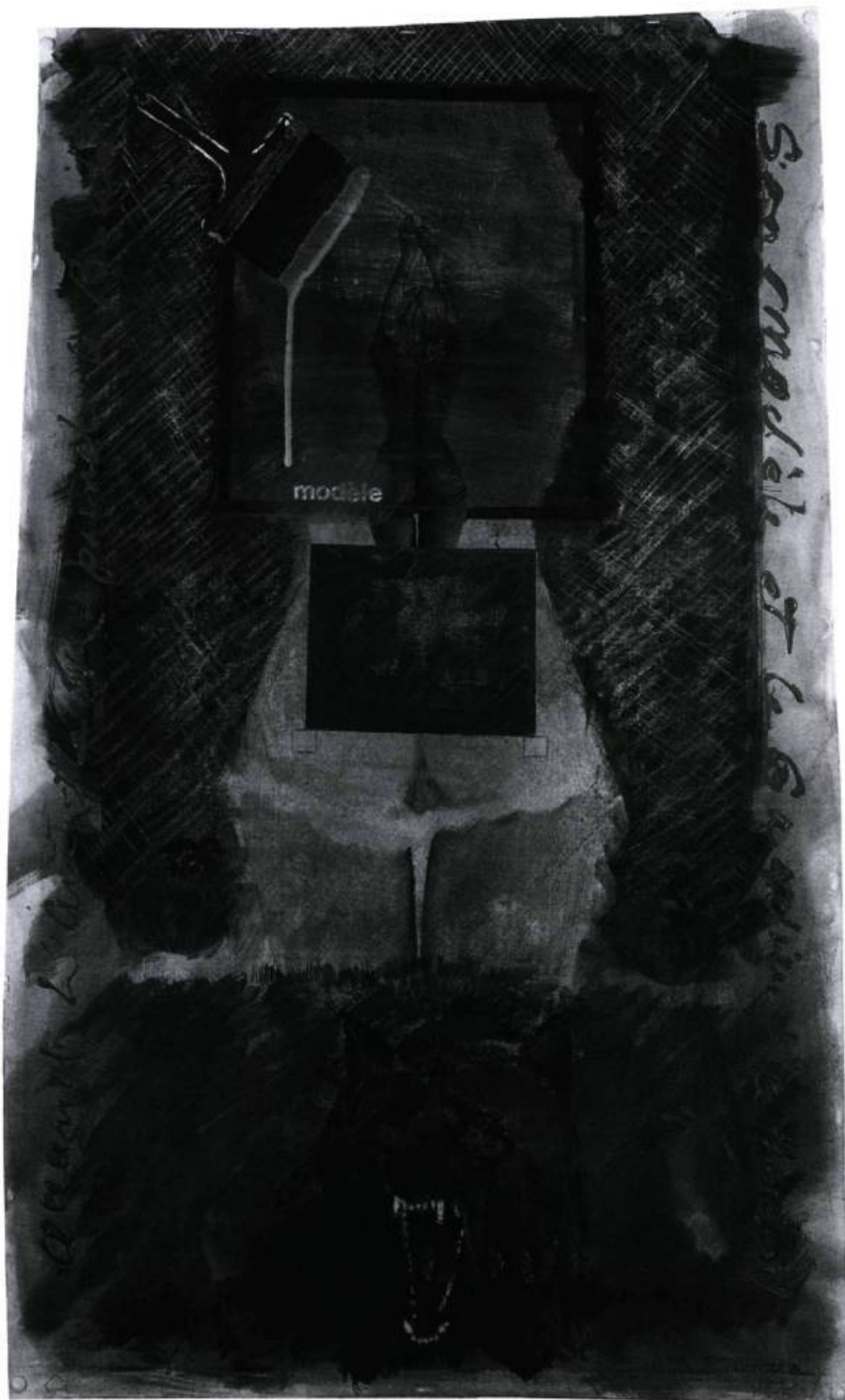
Le loup et le modèle, 1996 116 x 76 cm