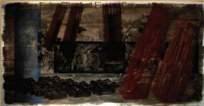
Parable series...clenched fists, greased palms, 1994