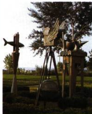
Jacek Jarnuskiwick Le parc des songes, 1995