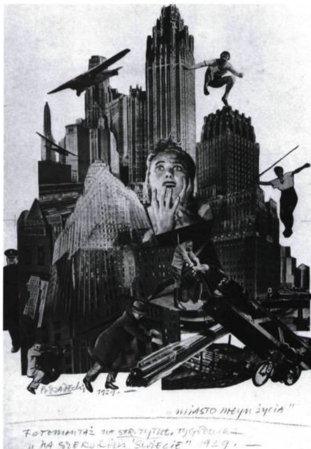
Kazimierz Podsiadecki «La ville - crâset de la vie», 1929 Technique mixte sur papier 43,5 X 29 cm

Le critique et philosophe de l'art français, Charles Delloye, est décédé à Paris le 8 janvier. Collaborateur à Vie des Arts au cours des années soixante, ce dernier avait été conseiller en art à la Délégation générale du Québec à Paris. Ayant séjourné au Québec en 1961 et 1962, il avait organisé plusieurs expositions d'art contemporain québécois en Europe dont l'exposition Borduas au Stedelijk Museum d'Amsterdam en 1960 et celle des Automatistes à la galerie Einaudi à Rome, en 1963. Il a joué un rôle déterminant dans la promotion des artistes de l'École de New-York et de l'École de Montréal.