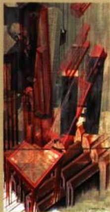
Parable n° 11... so it be, 1992