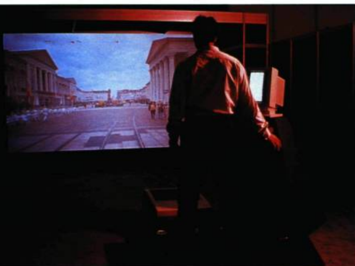
Réalité virtuelle Carte animée de la ville de Karlsruhe Michael Naimark, États-Unis

Les peintres de paysage ont tenté de faire entrer le spectateur dans leur peinture. Le regardeur immobile ne pouvait que parcourir du regard l'espace tridimensionnel aménagé sur la surface plane de la toile. Pour les théoriciens de la perspective, la peinture devait être une fenêtre ouverte sur le monde. Avec la réalité virtuelle, la métaphore de la fenêtre, qui persistait avec l'écran de cinéma, de télévision et de l'ordinateur, tombe. (1) Le dispositif de la réalité virtuelle est présenté comme un nouveau mode de représentation où l'on n'est plus devant l'image, mais «dans» l'image.