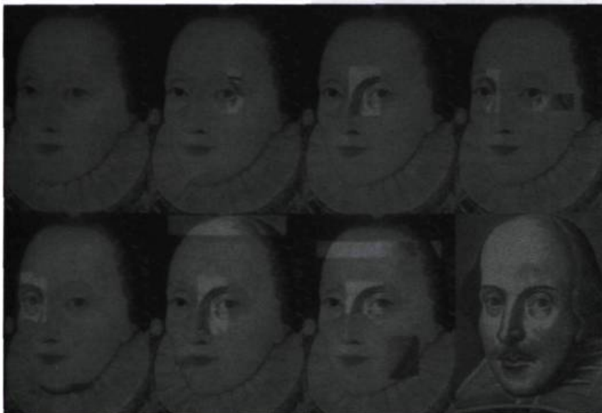
Analyse par ordinateur des portraits de Shakespeare et Elizabeth I Lilian Schwartz (États-Unis) The Mask of Shakespeare, 1992