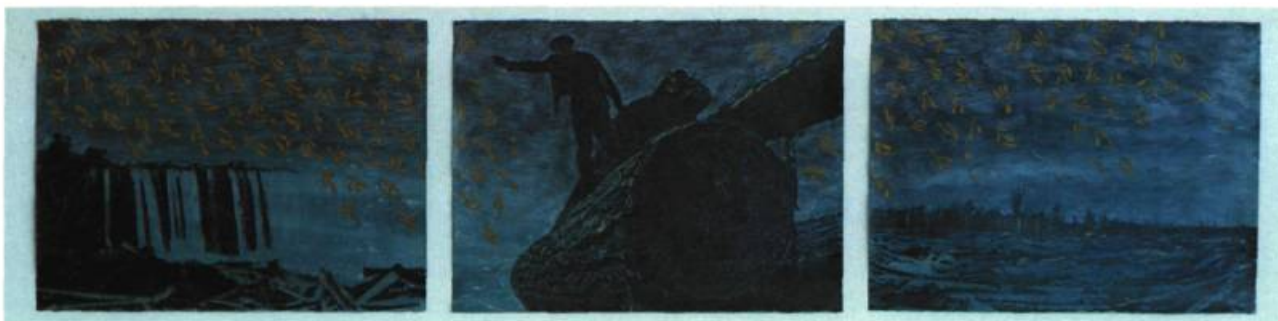
Samara Sky , 61 cm x 244 cm, triptyque, acrylique et graphite sur papier Arches, 1989

Samara Sky met en cause la puissance destructrice de l'industrie forestière. Le panneau central de cette œuvre qui représente une pluie toxique de samaras d'un jaune sulfurique, qui sont les fruits secs à ailes des arbres feuillus, suggère à la fois le renouveau et la régénération, la destruction et le désespoir.